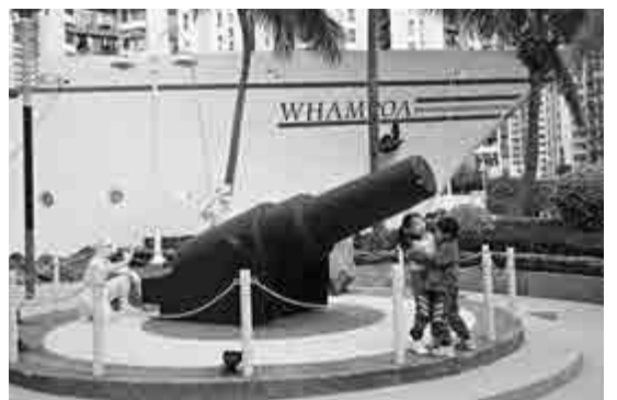
紅磡黃埔花園的英國海軍古炮

由於與政府關係良好，區內有三條街道以十九世紀末和二十世紀初出任船塢工程師兼總經理的洋人命名，以作紀念，包括機利士路、曲街和戴亞街。戰後政府應船塢方面要求在青州街建立九龍船塢紀念學校，一九四九年啓用，給員工子弟及街坊就讀，一九九五年因收生不足而結束。船塢於一九七〇年代遷往青衣，但今天行走該區仍可感受到船塢的蹤影。