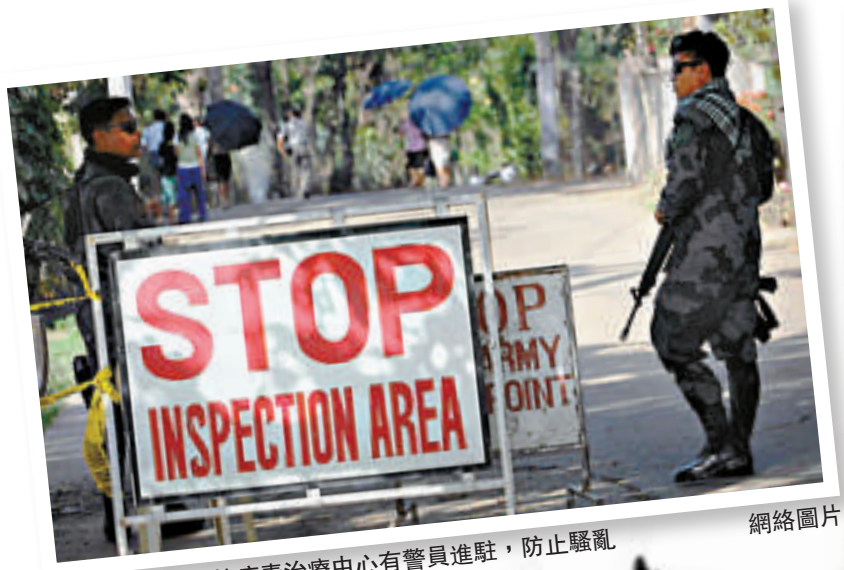
▲西非部分伊波拉病毒治療中心有警員進駐，防止騷亂