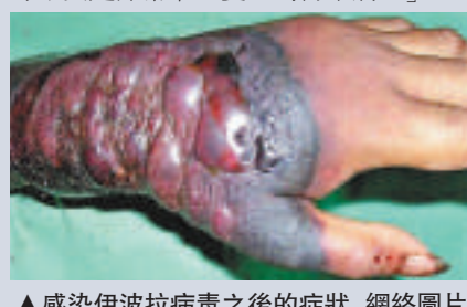
▲感染伊波拉病毒之後的症狀 網絡圖片

入並試圖協助該地區國家，而像是世界衛生組織（WHO）等國際組織也正試圖解決與遏止病毒威脅。不過伊波拉病毒確實是非常令人憂心的傳染病。」