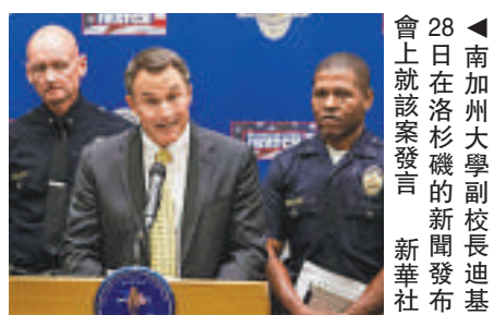
▲南加州大學副校長長迪基28日在洛杉磯的新聞發布會上就該案發言

當地時間24日凌晨零時45分許，一名男性中國留學生在洛杉磯南加州大學附近的第29街受到多名兇手襲擊，隨後受害者回到自己位於第30街的公寓。清晨7時許，警方接到報警，在受害者公寓發現屍體。受害者現年24歲，生前在南加州大學工程學院攻讀碩士學位。