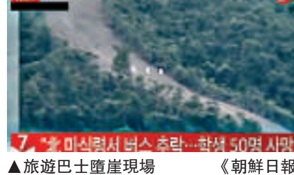
▲旅遊巴士墜崖現場

朝鮮官方電視台5月2日報道露營地竣工的消息時曾提及韓國發生的「世越」號客輪沉沒事故，報道稱：「全國學生因松濤園露營地竣工而歡笑笑語的同時，祖國南方年幼的學生們卻在野營途中遭遇橫禍，失去子女的父母們悲痛欲絕。」