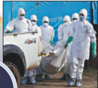
▲利比里亞一名女性感染者死亡後被抬出隔離區