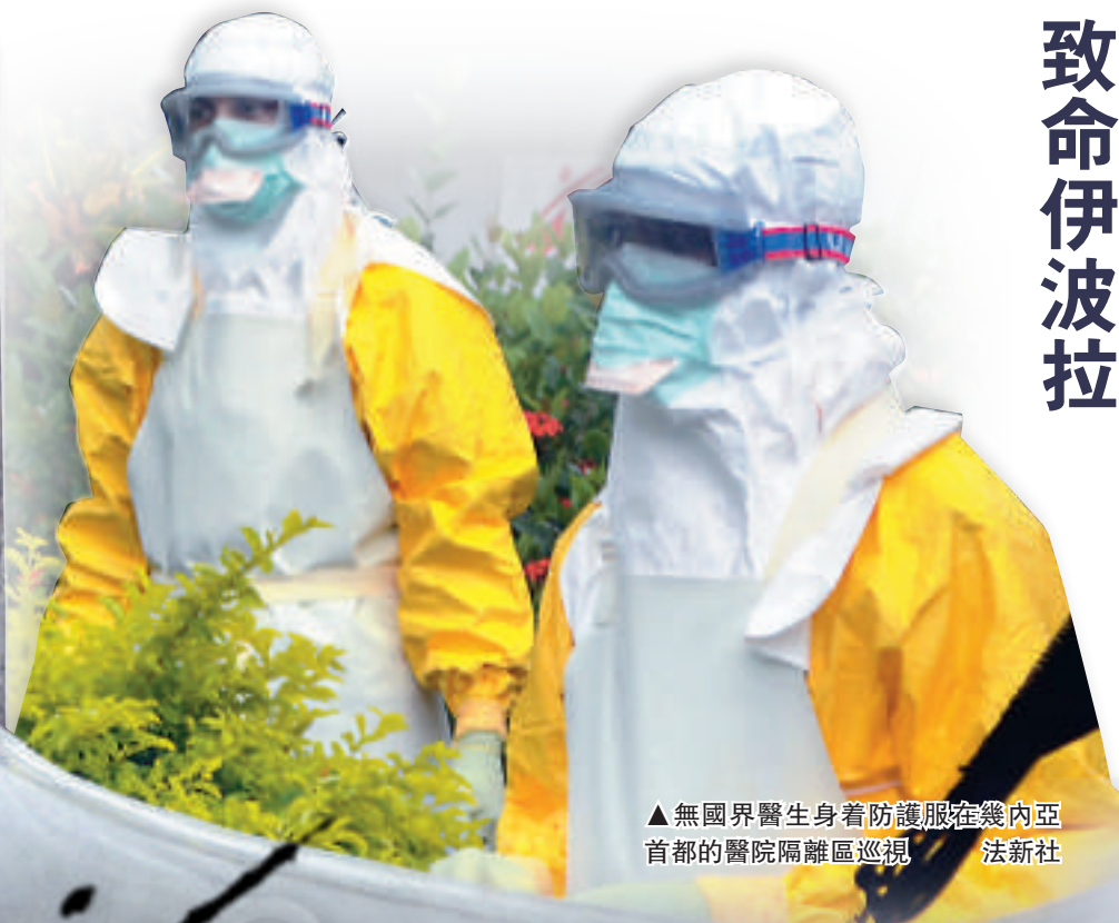
▲無國界醫生身著防護服在幾內亞首都的醫院隔離區巡視