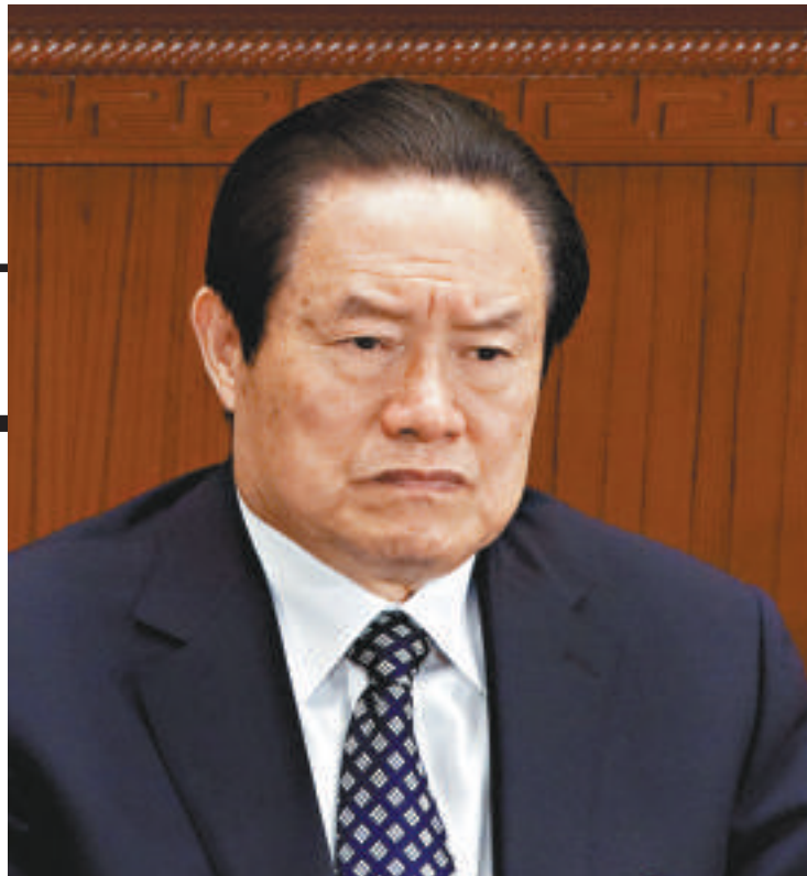
周永康 (原名周元根)