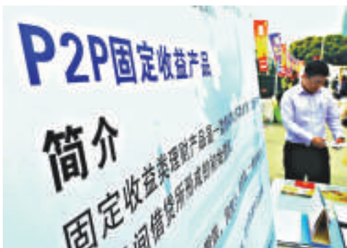
▲傳P2P網貸平台最低註冊資本1000萬元

自日前傳出「互聯網金融頂層設計方案或將出台」後，更多細則消息在坊間流傳。昨日有報道指，P2P網貸平台擬採取備案制方式管理，並接入央行徵信系統，最低註冊資本達1000萬元（人民幣，下同）。平台未來不能進行項目擔保、資金必須進行獨立託管，以及必須向監管部門披露逾期數據等。