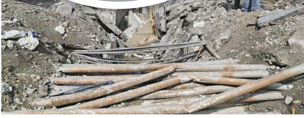
▲在氣爆現場，坍塌的路面下四處可見鋼筋外露、錯綜複雜的地下管線破裂，怵目驚心