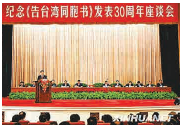
紀念《告台灣同胞書》發表30周年座談會 資料圖片

着。1979年1月1日，全國人大常委會發表《告台灣同胞書》。就在《告台灣同胞書》發表當天，鄧小平在全國政協新春座談會上發表重要講話，向世人宣布將祖國統一大業提到全黨工作的具體日程上來。他指出，「今天是1979年元旦，這是個不平凡的日子。說它不平凡，不同於過去的日子，有三個特點：第一，是我們全國工作的着重點轉移到四個現代化建設上來了；第二，中美關係實現了正常，第三，把台灣回歸祖國、完成祖國統一大業提到具體的日程上來了」。