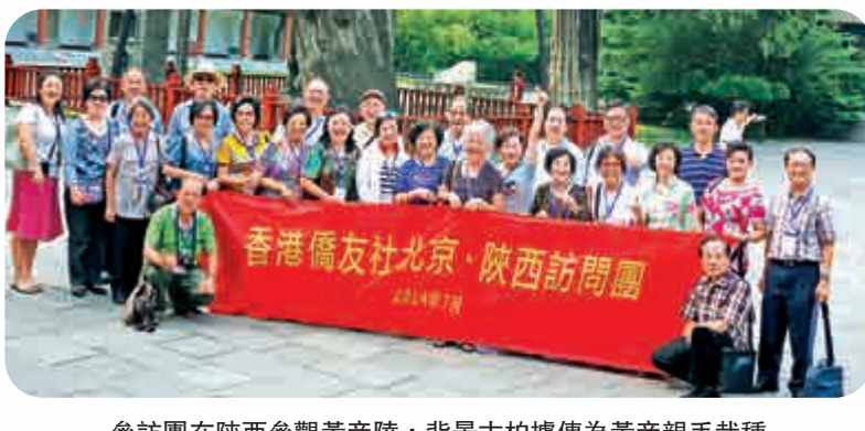
參訪團在陝西參觀黃帝陵，背景古柏據傳為黃帝親手栽種