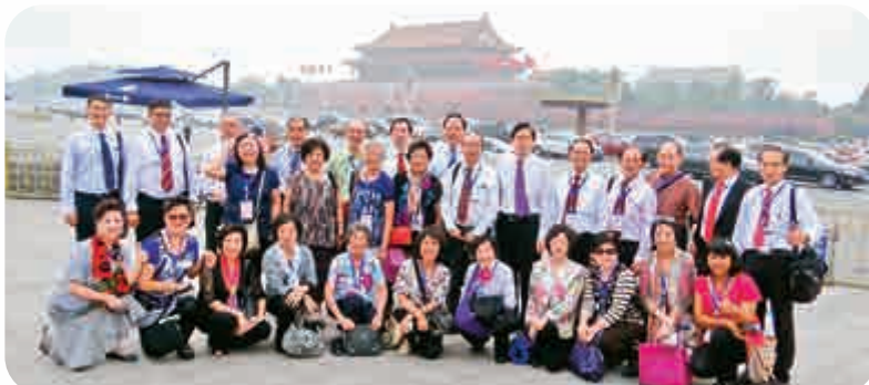
僑友社參訪團暢遊天安門廣場