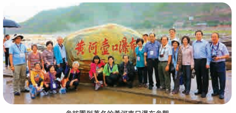
參訪團到著名的黃河壺口瀑布參觀