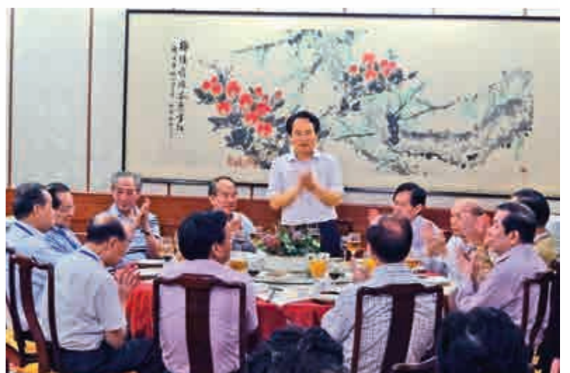
國僑辦譚天星副主任在宴會上發表熱情洋溢的講話