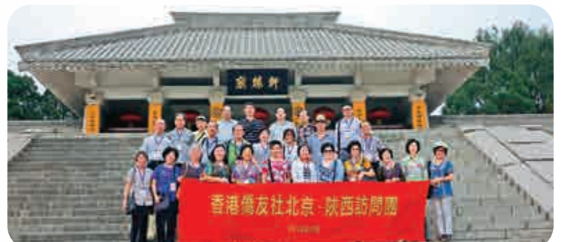
僑友社參訪團到黃帝陵軒轅廟參觀