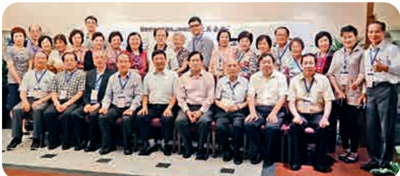
陝西省僑辦領導親切接見參訪團

7月5日，參訪團前往「華清池」和「兵馬俑」參觀。西安是著名的文化古都，西周、秦、漢、隋、唐等13個王朝先後在這裡建都。華清池景區最為人樂道的是發生在千多年前以前唐玄宗與楊貴妃的愛情羅曼史和上世紀三十年代震驚中外的「西安事變」。秦始皇兵馬俑是秦始皇陵的一部分，