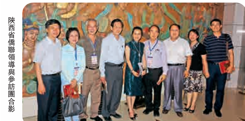
陝西省僑聯領導與參訪團合影