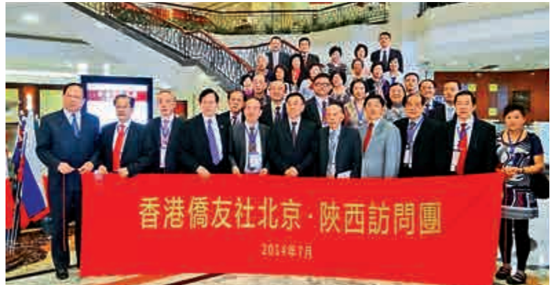
中國僑聯主席林軍（前排左六）、副主席喬衛（前排右四）與參訪團全體成員合影