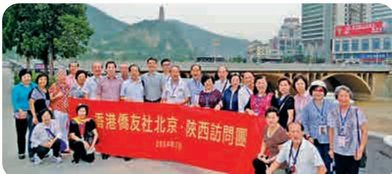
參訪團在寶塔山下、延河邊拍照留念