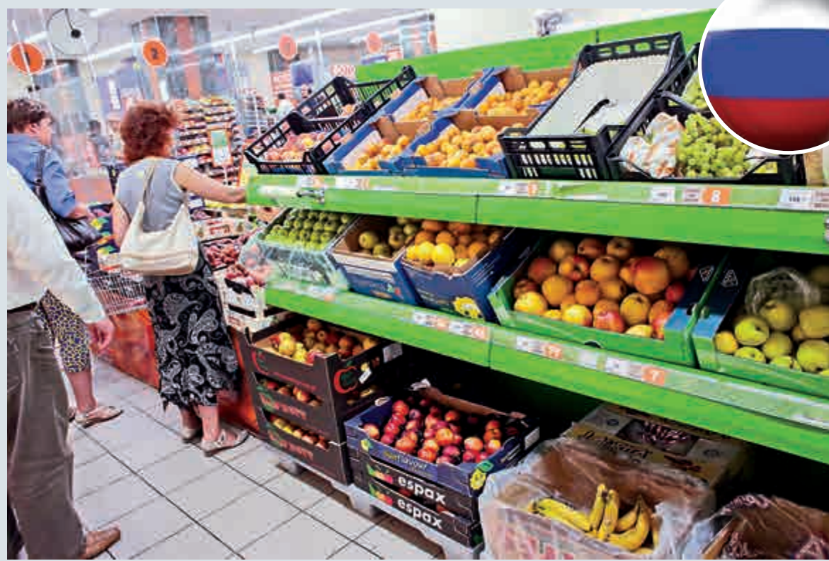
▲俄羅斯居民7日在莫斯科市中心的一家超市選購進口水果