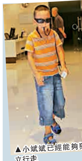
▲小斌斌已經能夠獨立行走