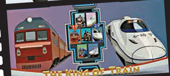
THE KING OF TRAIN