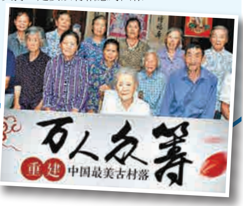
►眾籌重建古村項目發起人包括村中百歲老人

眾籌譯自國外crowdfunding一詞，是指用團購+預購的形式，向網友募集項目資金。眾籌有三個規則，一是籌資項目必須在發起人預設的時間內達到或超過目標金額。二是籌資項目完成後，網友將得到發起人預先承諾的回報，回報方式可以是實物，也可以是服務，如果項目籌資失敗，那麼已獲資金全部退還支持者。三是眾籌不同於捐款，支持者的所有支持一定要設有相應的回報。