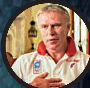
▲傳奇球員 Fetisov 講述其冰上曲棍球的生涯