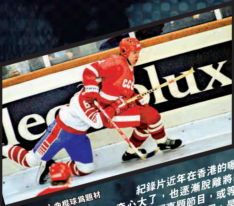
▲以前蘇聯冰上曲棍球為題材的《冰上最強》