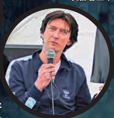
▼導演 Elvebaak 為《芭蕾舞少年》拍攝受訪者三年