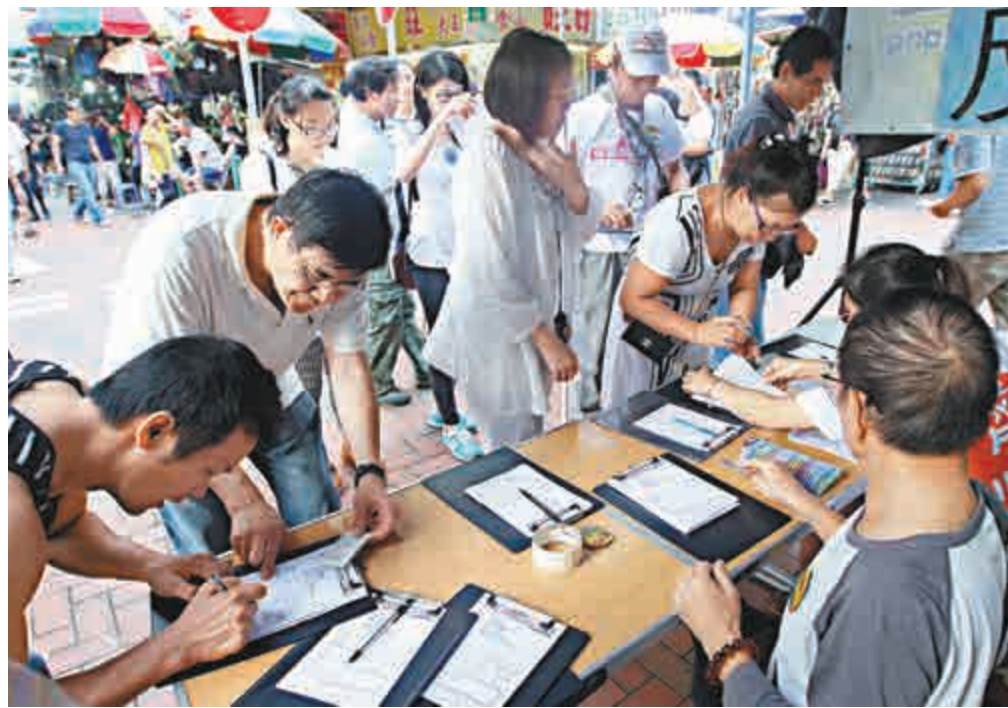
▲市民紛紛上街表達佔中，以及爭取和平普選的訴求

對於調查指，超過六成市民接受「不完美」的提名程序，希望在2017年「一人一票」普選行政長官，全國港澳研究會會員、基本法委員會委員劉迺強對本報記者表示，現時本港的政治氣氛和力量對比發生很大的轉變，相信民意將繼續升溫。