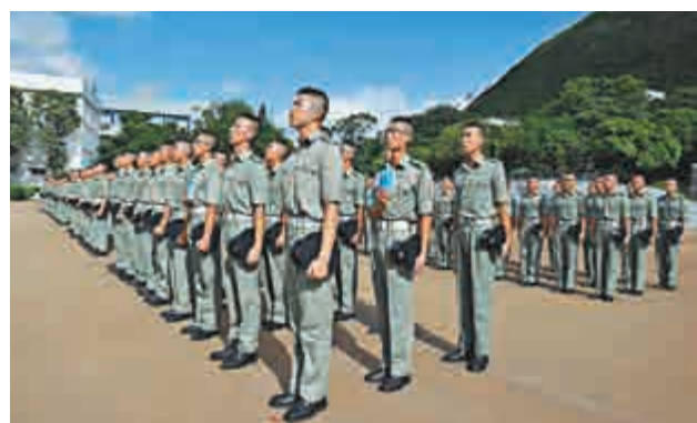
▲新學員完成訓練後，將會成為首批獲得資歷架構認可專業文憑的警員