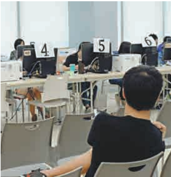
▲未獲院校的文憑試考生及自修生，昨日赴恒生管理學院報讀課程

此外，中大今年透過「校長推薦計劃」共取錄90人；而獲「運動員獎學金」的則有12人，分別在田徑、劍擊、游泳、划艇、乒乓球、排球、手球及籃球等運動有傑出表現。