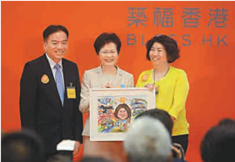
▲「築福香港」昨日舉行結幕禮，林鄭月娥（中）及黃友嘉（左），向紀文鳳（右）致送紀念品

「築福香港」總支出約為480萬元，主要用於大型活動統籌及推廣項目，當中300萬元來自香港賽馬會慈善信託基金的捐助，其他個別活動開支由各主辦機構自行負責。