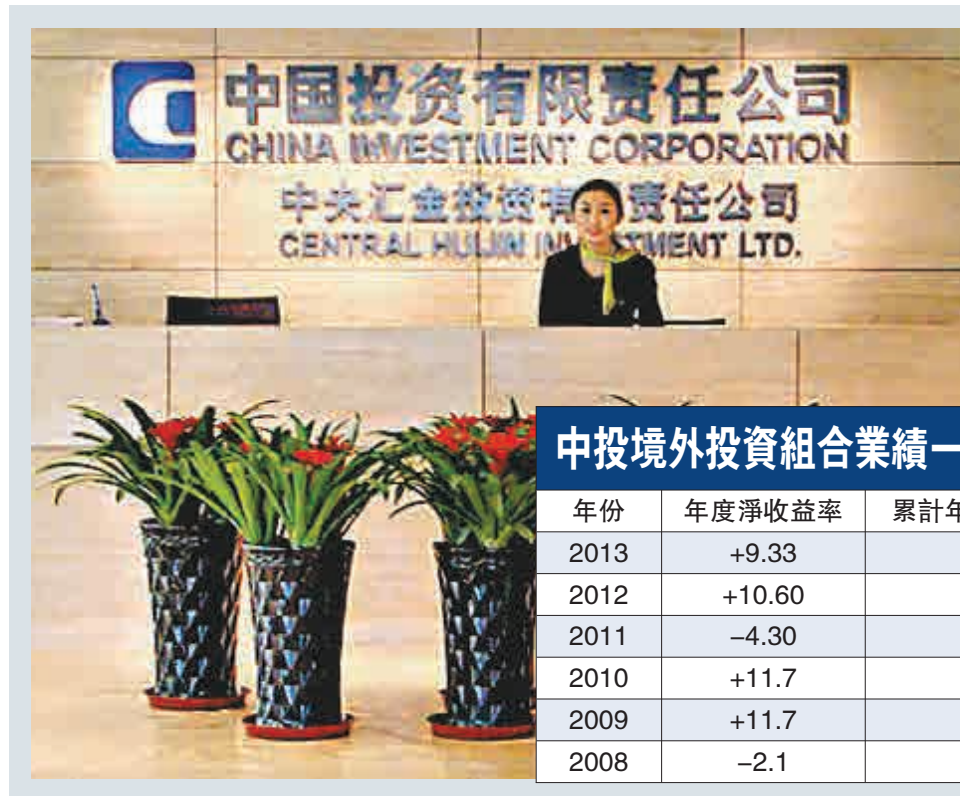
中投公司去年境外投資組合收益達9.33%