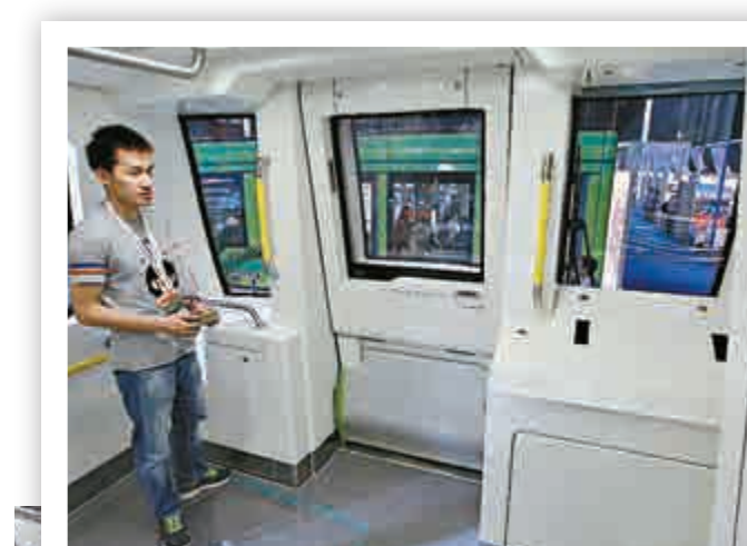
一名參觀者在「無人駕駛」地鐵列車車頭處參觀。該列車的車頭沒有常規的駕駛室設計

早在今年6月17日，中國首列無人駕駛地鐵列車就亮相「2014中國國際軌道交通展」。據悉，這輛無人駕駛地鐵列車為3節編組，最大載客約1500人，外觀與普通地鐵相似，不設駕駛室。據悉，2002年，世界上首條「無人駕駛」地鐵在丹麥首都哥本哈根投入使用，被授予「世界最佳地鐵」等諸多獎項。目前，全球多個大都會都應用了全自動無人駕駛地鐵，如法國巴黎和里昂、德國紐倫堡、巴西聖保羅、西班牙巴塞羅那、匈牙利布達佩斯等。