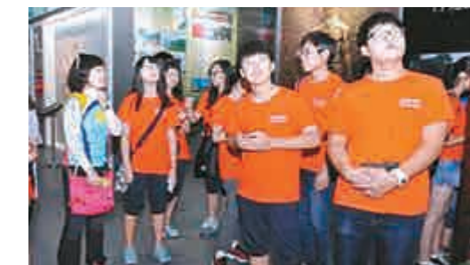
韓國學生們參觀株洲市展覽館，了解城市發展歷史

此外，雙方學生還在株洲標誌建築神農城水秀廣場，舉辦了一場頗具各自民族特色的中韓文藝聯歡晚會，而集體住宿和家庭寄宿活動，更讓韓國學生難忘。據了解，為讓中國學生感受韓國的風土人情，中國的10名來自湖南、安徽、山東等地區的結對中學生還將赴抱川市回訪。