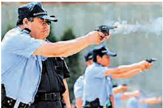
▲警員在北京人民警察學院接受射擊訓練 資料圖片