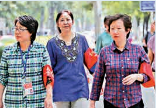
▲今年5月起，北京動員85萬名志願者上街巡邏 資料圖片