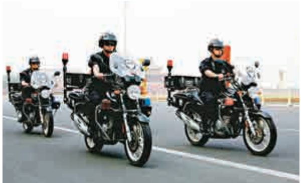
▲北京反恐特警在長安街上騎車巡邏