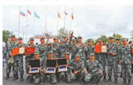
▲中國代表團在頒獎儀式後慶祝

今屆坦克兩項世錦賽於8月4日啓動，整個賽程有俄羅斯、安哥拉、亞美尼亞、白俄羅斯、委內瑞拉、印度、哈薩克斯坦、中國和吉爾吉斯斯坦等共12個國家參加賽事。