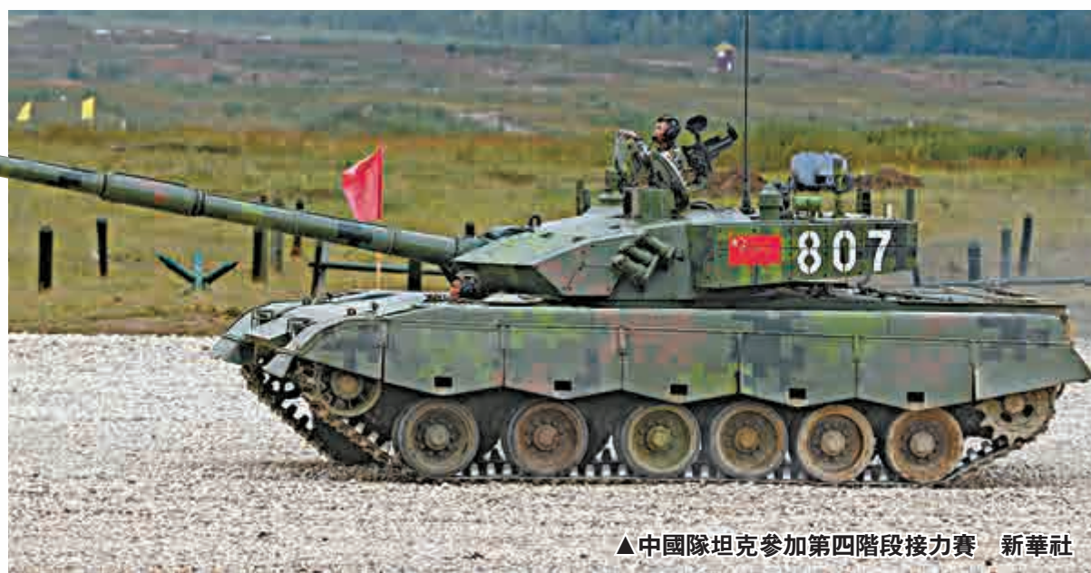
▲中國隊坦克參加第四階段接力賽