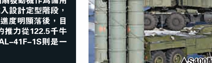
▲S400配有三枚射程不同的導彈

據央視報道，軍事專家宋曉軍表示，S400系統主要的好處，第一是導彈的通用性比較強。第二是功能上較