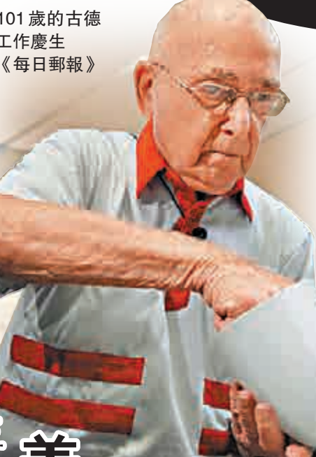
▶101歲的古德曼工作慶生 《每日郵報》

村民說，登祿普斯夫妻一開始用大貨車堵住戴森夫婦前門，後來決定設立一道牆，永久地圍住他們。