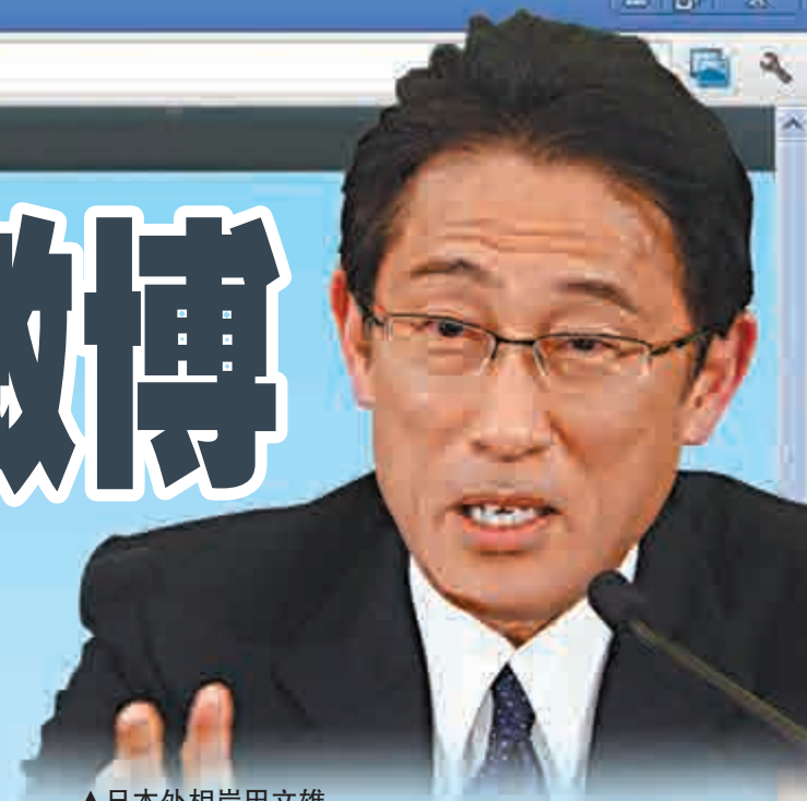
▲日本外相岸田文雄 ▲日本駐華大使館微博截圖 ▼中國釣魚島 互聯網

據查詢，目前在微博可以查到日本官方帳號有日駐華大使館官方微博，開設於2011年2月1日，主要內容為「介紹大使的動態、新聞文化中心的活動以及日本相關的資訊等」，粉絲數約為29萬。