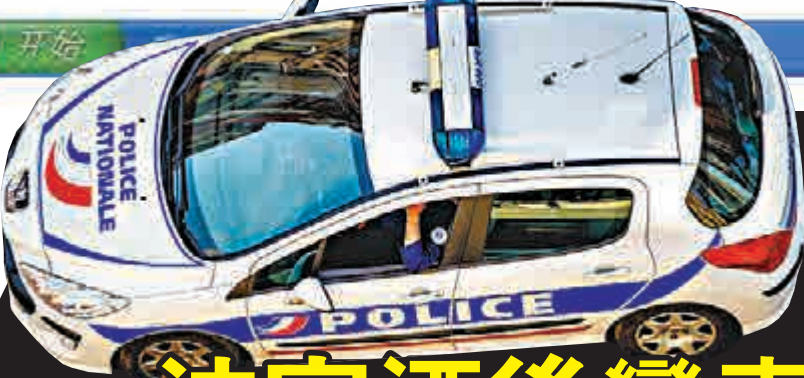
◀法國一法官醉後誤將警車當作出租車攔停