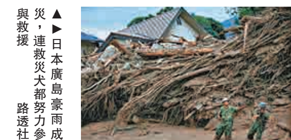
▲日本廣島島豪雨成災，連救災犬都努力與救援

【大公報訊】據中央社、共同社21日消息：日本廣島豪雨成災，連救災犬都努力參與救援，但首相安倍晉三20日從度假別墅回到東京坐鎮指揮後，又返回別墅，在野黨21日對此表示震驚。