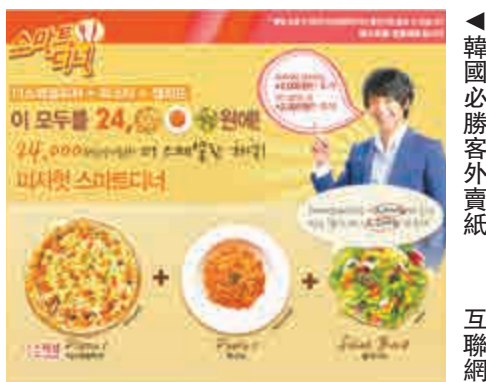
◀韓國必勝客外賣紙 互聯網

此前，也曾有報道指韓國普遍有英文至上的現象。近來，韓國出現許多英語酒吧，在這些酒吧中，只說英語，菜單也全都以英文書寫，即使酒吧老闆堅稱，這純粹是經營策略，與歧視無關，但都無法平息韓國網友的不滿。