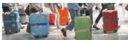
▲調查顯示瑞士「自殺遊客」人數攀升 《華爾街日報》