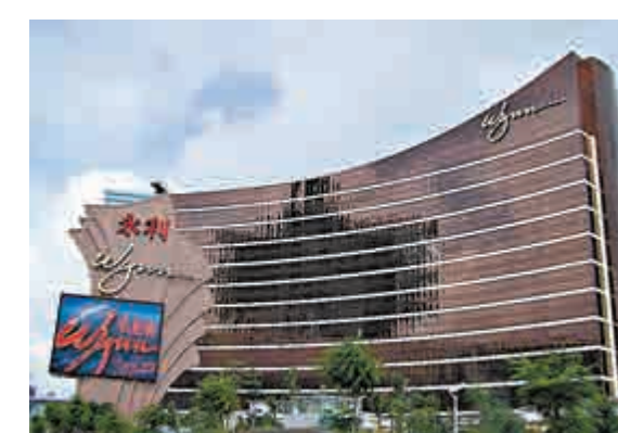
▲永利澳門昨公布中期業績,半年盈利36.5億跌1.2%

期內,因發行7.5億美元(約59億元)的優先票據,集團資本負債比率上升17個百分點至56.4%,相關債務將於2021年到期。早前有永利的股東去信澳門政府,要求永利交代於2008年曾向一間公司支付5000萬美元,以取得有關土地的使用權。集團於公告表示,接獲澳門廉政公署通知,就於澳門路氹地區的土地提交若干資料,與廉政公署合作。