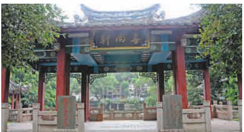
▲冶山北麓的歐冶子鑄劍處——歐冶池已被列為市級文物受到保護

據史載,早在秦漢時期,福州就與海外有了初步的海上交通。當時在屏山東麓附近就有造船場,並有船舶通向他鄉。隨着福州海上交通進一步擴大,屏山東麓一帶逐漸成了東冶(今福州)中心城區內煙稠密地區。依託於東冶港的對外貿易,福州街市初成。西漢始元二年(公元前85