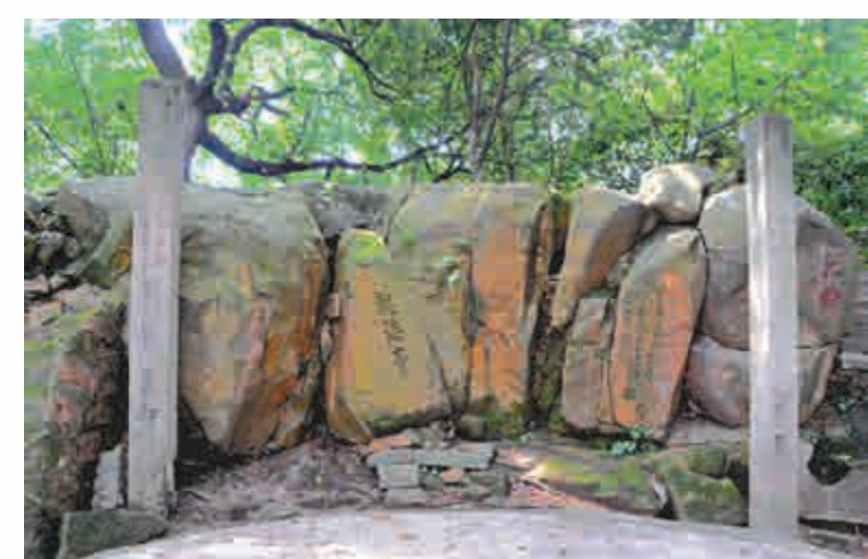
▲冶山之巔的觀海亭處只剩下兩根石柱和眾多摩崖石刻

正如福州鼓樓區與海上絲路相生相長一樣,台江區也因海上絲路而形成。唐初,在這裡首設行政機構——烏石鄉,轄國鼎里、下帷里、令德里、嘉