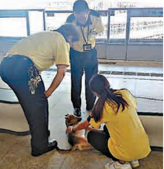
▲港鐵指柴灣站檢獲無人認領狗隻

【大公報訊】一波未平，一波又起！港鐵粉嶺站，上周有狗闖入路軌被列車輾斃，有政黨及自稱愛護動物人士，連日炮轟港鐵處理失當；事件還未平息之際，港鐵港島線，昨又有狗隻「離奇」出現，職