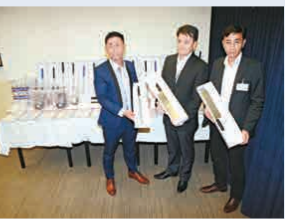
▲行動中檢獲的一批武器

由於當地有不少職位空缺，加上收入可觀，故頗受本港青年及背包客歡迎。可是當地農場工作環境一般，未必設有宿舍，而且面積較大、交通不便，不少工人需於清晨出門，自行駕車上班。