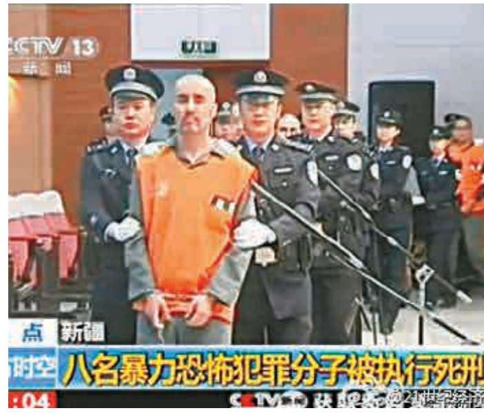
▲近日，犯有組織、領導、參加恐怖組織罪，故意殺人罪，放火罪，非法製造、儲存、運輸爆炸物罪，以危險方法危害公共安全罪的8名暴恐罪犯被執行死刑 視頻截圖

法院依據物證、書證、證人證言、被害人陳述、被告人供述、鑒定意見、視聽資料等證據，依法作出上述判決。