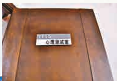
▲辦案基地心理測試室