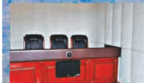
▲訊問室犯案人員的座位，前有攝像頭，房間牆壁用特殊材料，除了隔音效果，還防止官員自殘 網絡圖片