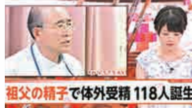
祖父的精子で体外受精 118人誕生

宗教學者山折哲雄亦表示，醫學昌明無疑解決夫婦不育問題，但絕不能忽視所帶來的社會、道德、倫理和法律問題。不過，也有醫生認同老爺捐精助媳婦懷孕的做法，「從遺傳基因學來看，丈夫的父親才是無可挑剔的最佳捐精者」，因為可避免匿名捐精者的後代與人工受孕的嬰兒，將來近親通婚。