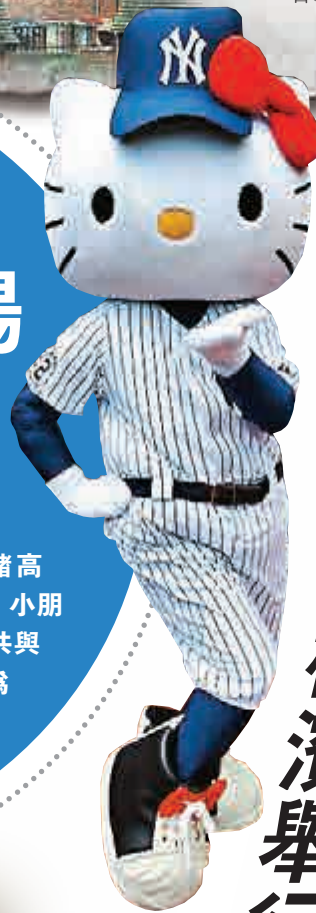
▶由六千名志願者人肉砌出的土耳其國父阿塔蒂爾克畫像 ▲着棒球裝入洋基主場的Hello Kitty

Hello Kitty穿上洋基隊波衫登場，現場情緒高漲。1.8萬名球迷獲得Hello Kitty公仔做紀念，小朋友在收到公仔後都笑逐顏開。Hello Kitty一共與30支大聯盟球隊合作，並推出周邊商品。為配合秋天舉行的美日棒球比賽，產品預計亦將會在日本發售。