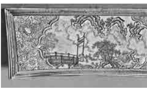
合中國繪畫技巧，巧妙繪於瓷枕上。除了白釉黑花、磁州窯之白地（或黑地）鐵鏤花、黑底褐衫、赤繪等...