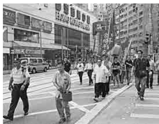
石塘咀孟蘭勝會的請神巡遊行經永安倉舊址