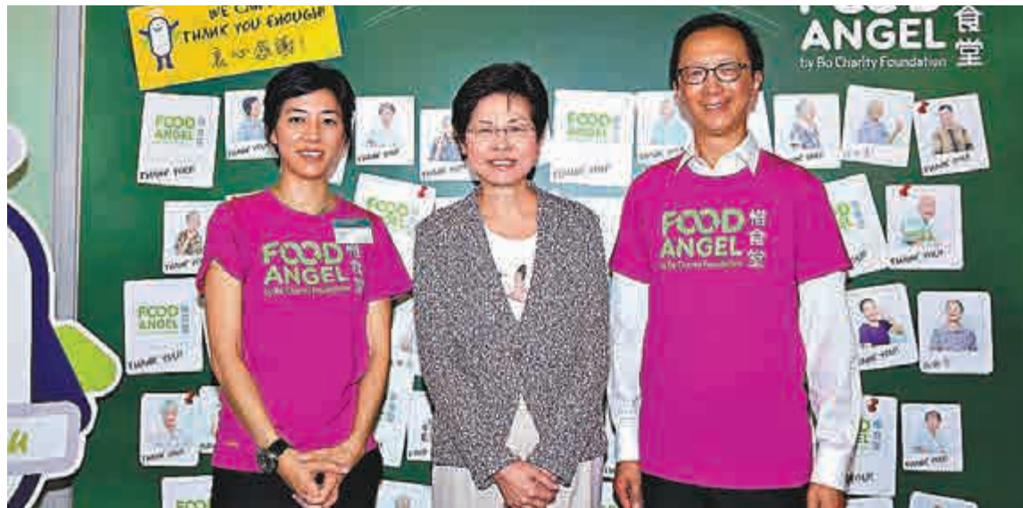
▲林鄭月娥（中）以珍惜食物作譬喻，呼籲市民珍惜普選特首的機會，讓全港超過500萬合資格選民，於2017年能以「一人一票」方式，選出下任行政長官。圖右為梁錦松

對於有人稱人大制定的行政長官提名門檻過高，令政改方案沒有討論空間，將引發「佔中」，立法會主席曾鈺成昨日在出席公開活動時表示，「香港歷史不會因『佔中』而終結」，又表示無法理解為何方案尚未出現，就說方案不能接受。曾鈺成說，人大常委