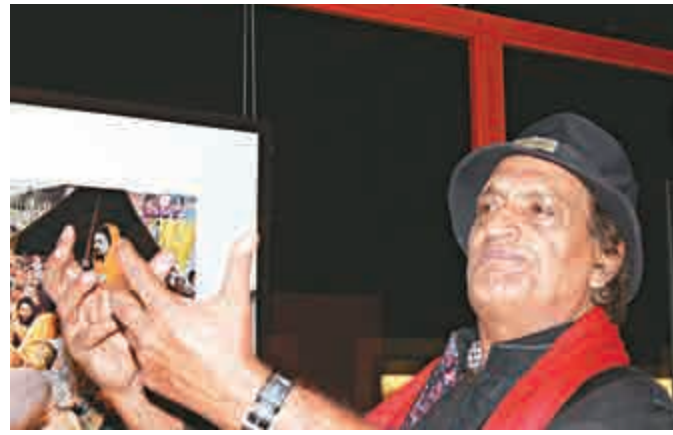
▲洛古雷決定按快門的那一刻，像有人突然撞他肩膀，催促道「快拍啊！」

編者按：「微光中的印度——洛古雷攝影展」即日起至九月二十一日在太古坊ArtisTree舉行。