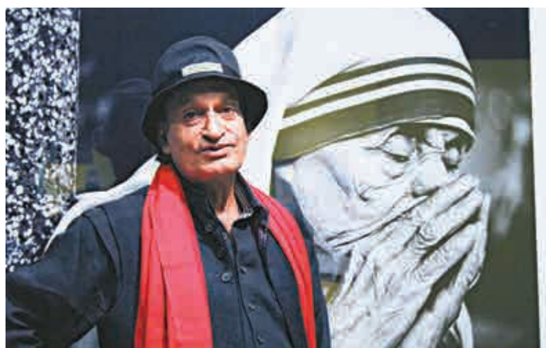
▲洛古雷說：「在你們拍我的時候，請拍出德肋撒修女的面孔，她很重要。」