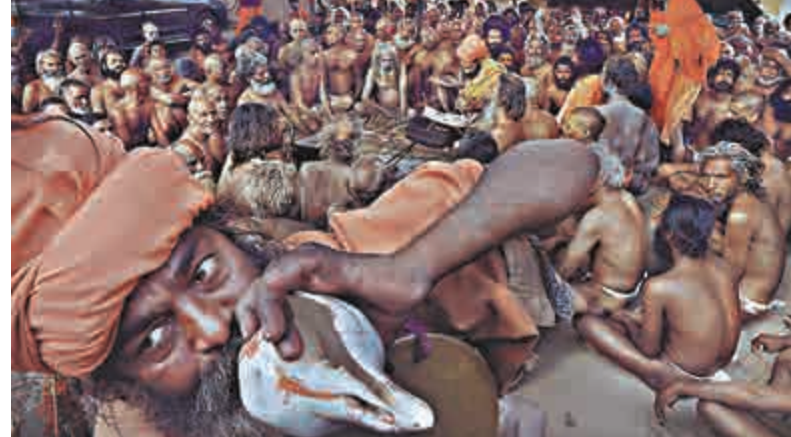
▲《Naga Sadhus of Juna Akhara at Their Camp》，在拍攝時，那個吹螺號的人突然轉過來

筆者還在疑惑，上屆國際攝影節請來森山大道，今屆請何方高人後繼？結果今年國際攝影節換了個路數——請來了洛古雷（Raghu Rai）。當你站在展廳，一張張看過來，會輕嘆一口氣——原來風格與前衛皆是虛無。一片在工業進程和傳統文明夾縫中掙扎的土地，才是一部精彩紛呈又亂象叢生的百科全書。除此之外，還要有一雙巨細無遺地注視這片土地的眼睛，那是記錄史詩的眼睛。「微光中的印度——洛古雷攝影展」昨日於太古坊開幕。趁此時機，本報記者訪問著名攝影師洛古雷。