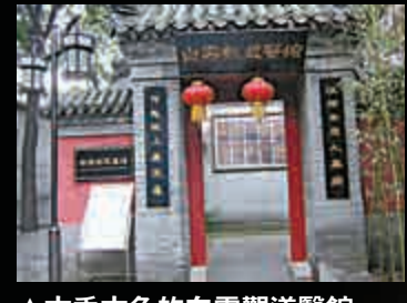
古香古色的白雲觀道醫館

白雲觀始建於唐開元二十六年（公元739年），與白雲觀的道教並行於天下的道醫，至今已逾1200年的歷史。白雲觀道醫不僅效力朝廷、達官顯貴，也行醫民間。入宮內王府，則重在延年益壽，煉丹養生，保健美容；懸壺道觀民間，則熱衷驅除瘟疫，捨藥治病，普濟飢民。道教特有的養生術及內丹修煉方法等均與中醫藥學有著淵源關係。自古以來，中國就有「醫道同源」、「十道九醫」之說。在中國歷史上，聲名遠揚的葛洪、藥王孫思邈等人，既是道士，也是醫學家。道教醫學通過認識自然界的變化規律來研究掌握人體生命活動的變化規律，如自然界的「風寒暑濕燥火」六種自然氣象被稱為六氣，影響着人體的調節適應機能及病原體的滋生傳播。