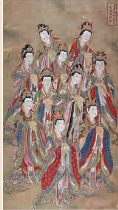
▶展品《往古孝子順孫等眾》