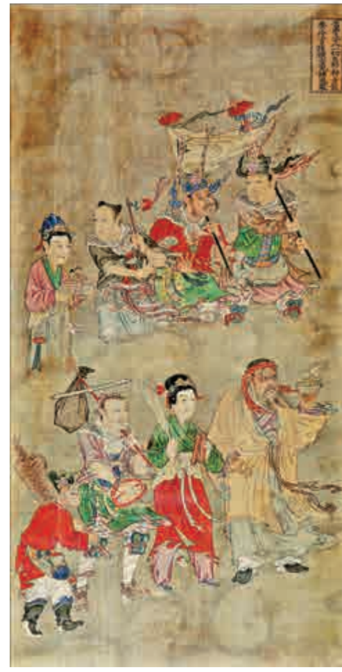
▲展品《一切巫師神女散樂伶官族橫亡魂諸鬼眾》

壯漢背負老婦，其餘挑擔背筐隨行，作倉皇逃難狀。下層十二人，其中三位老人步履艱難，子孫從旁攙扶行進，一少婦懷抱嬰兒，嬰兒依偎母親胸前，母嬰之間的愛撫情狀十分傳神。