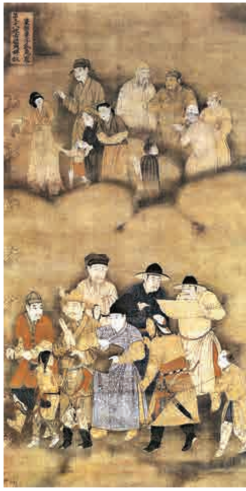
▲展品《往古雇典婢奴棄離妻子孤魂眾》