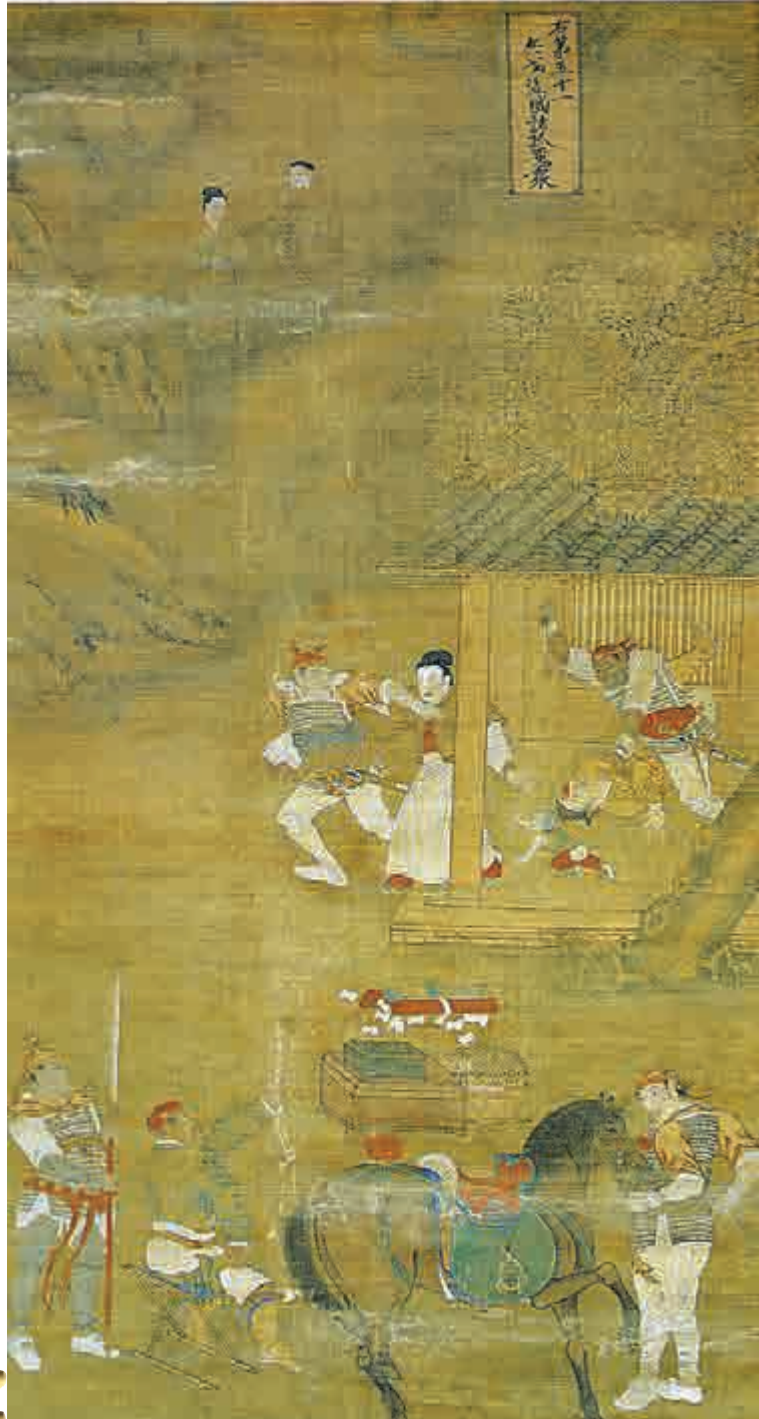
▲展品《兵戈盜賊諸孤魂眾》