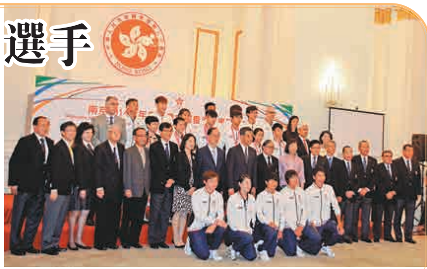
▲特首梁振英（第二排左九）為祝捷會主禮

霍震霆亦為運動員取得佳績而高興，他表示，會繼續推動政府與本地體育界合作發展體育而努力。