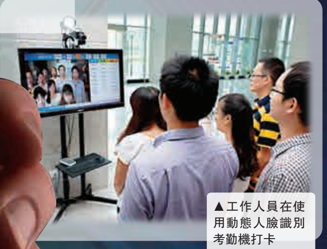
▲工作人員在使用動態人臉識別考勤機打卡