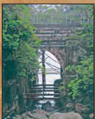
▲有着尖頂拱的石橋四，建築技藝精湛，最具探訪價值