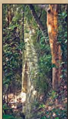
▲石橋一深藏灌木叢，不易發現