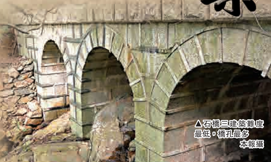
▲石橋三建築難度最低，橋孔最多