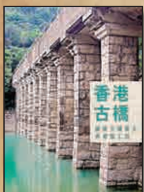
▲李偉明著作《香港古橋——圖說古橋歷史與建築工程》