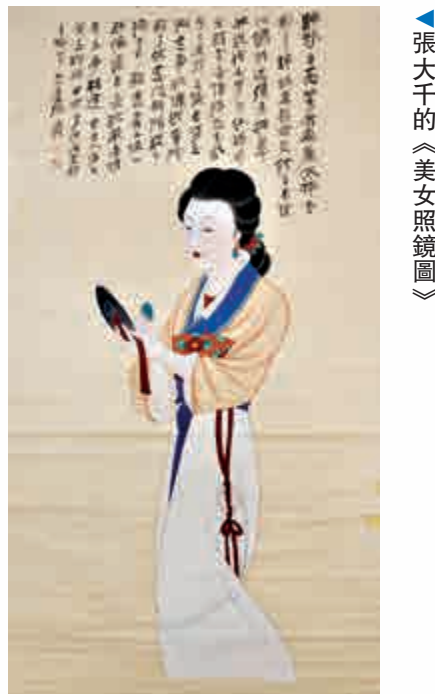
▲張大千的《美女照鏡圖》