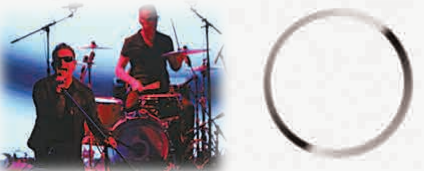
▶ U2樂隊受庫克邀請在發布會上獻唱

臉上肯定會充滿笑容。」 報道指，庫克表示喬布斯生前並不知道有Apple Watch這個項目。但他說：「雖然我們是從他過世後才開始這個項目的開發，但喬布斯的DNA也流淌在我們的血液中。我們的視點都與他如出一轍。對我來說，他的個性並不重要，他的想法、品位、與眾不同的視角，所有這些都還在蘋果完整保留。我認為他的DNA將會永遠是蘋果的根基。」