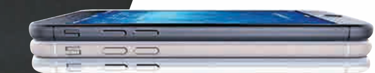
▲中國內地運營商此前流出的iPhone 6照片