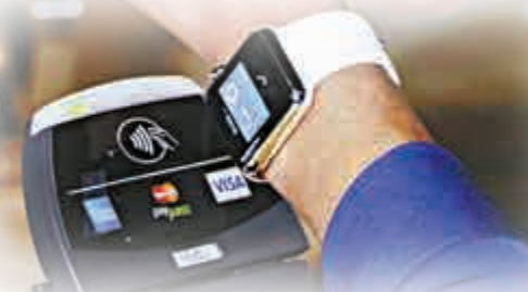
▶ Apple Pay是此次發布會的一個重點推薦，新智能手機和手表上均可使用該功能