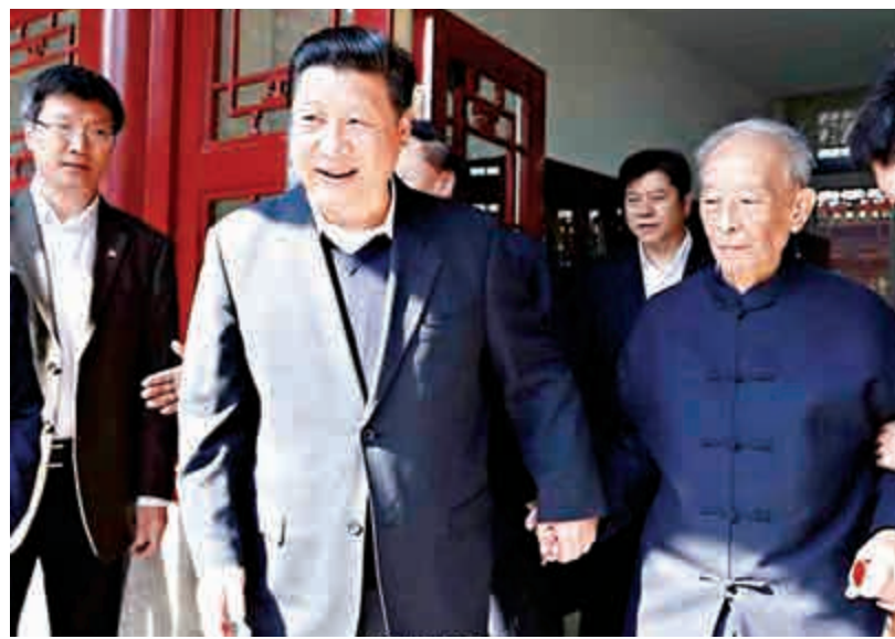
▲今年五月，國家主席習近平訪問北大，曾與湯一介促膝交談