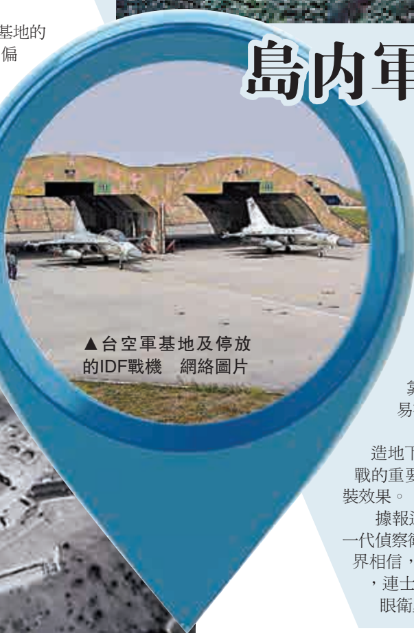
▲台空軍基地及停放的IDF戰機

據報道，軍事光學偵察衛星由美國率先發展，在1959年發射第一代偵察衛星「發現者號」進入太空，至今已發展出五代偵察衛星。外界相信，現時美國最先進軍用偵察衛星，可以拍出0.05米分辨率的影像，連士兵手中拿住的槍械型號，亦可以看得清清楚楚。其中KH-12鎖眼衛星，被認爲是全球最先進的衛星之一。