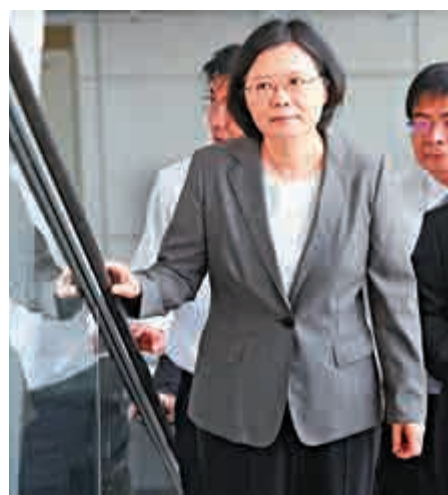
▲蔡英文(前)13日出席美國重返亞洲與亞太區域安全國際研討會

她說，在兩岸關係整體上，民進黨願面對兩岸長期存在的歧見，爲積極尋求兩岸爭議的化解之道，民進黨會以堅定、務實、穩健的步伐，努力和對岸建立全新的互動及溝通模式，以實踐和平穩定發展的兩岸互動關係。