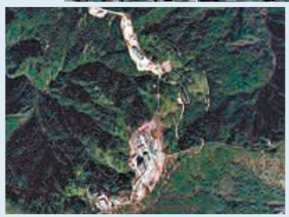
▲位於新竹樂山長程預警雷達主陣地上方首度遭曝光的防禦陣地