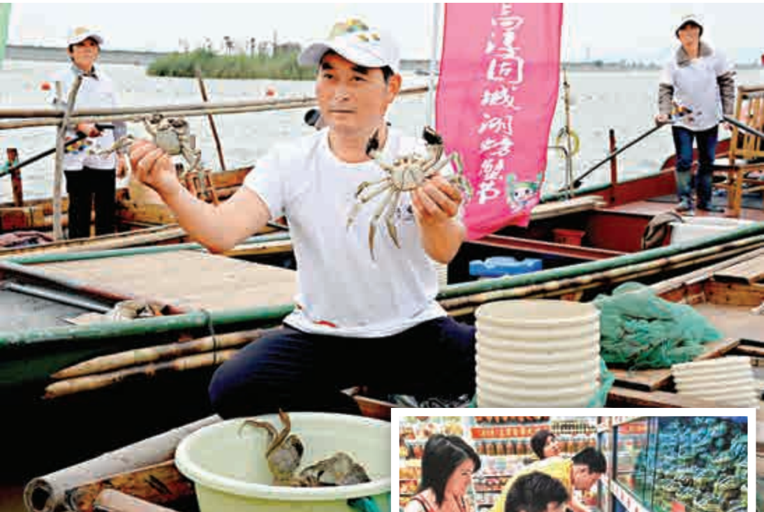
▲固城湖蟹農展示剛捕撈的大闸蟹