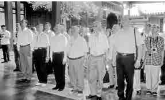
▲葉昌桐率台灣將軍團成員在馬尾昭忠祠拜謁中法馬江海戰壯烈殉國的將士。前排右起：吳濟時少將、盧庸籬少將、徐學海中將、葉昌桐上將、宋炯少將、王安懷少將

公祭儀式上，兩岸各界人士向將士墓群行三鞠躬禮、拋灑花瓣。福建省文史研究館館長盧美松誦讀了祭文。全國人大法律委員會委員、福建省文化經濟交流中心常務副理事長倪英達代表各界人士講話，他說：海峽兩岸各界人士在此舉行公祭儀式，用無限追思表達對福建戍台將士的景仰之情，用同祭祈願傳遞繼承船政先輩遺