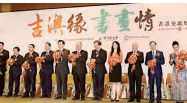
▲嘉賓為書畫交流展主禮

【大公報訊】記者盧洽澳門報導：「吉澳緣 書畫情」書畫交流展暨慶祝澳門回歸十五周年昨日在澳門旅遊塔會展娛樂中心開幕，展覽呈現逾百幅來自吉林和澳門的書畫作品。全國政協副主席何厚鏞、澳門中聯辦主任李剛及兩地書畫界人士出席開幕禮。