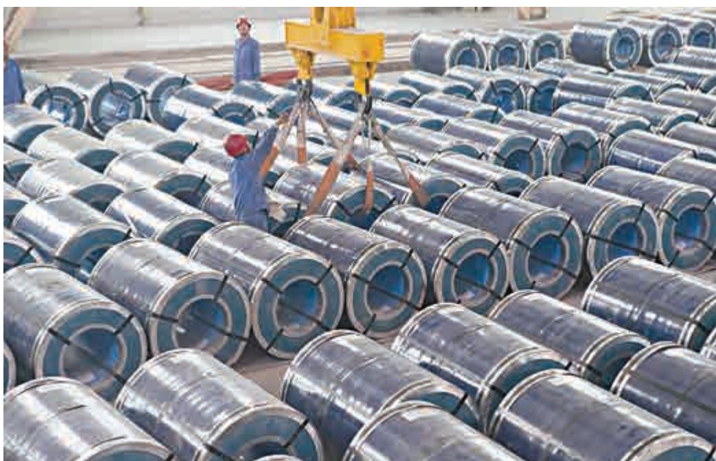
中國八月經濟數據出現驚嚇，工業生產、零售額、固定資產投資及發電量等全面走樣，顯示經濟尚未回穩，成為外資再度做空中國的藉口。

看來樓市車市等的調整乃影響工業及投資增長的主要原因，但卻是必要及健康的復甦過程，故短期利淡長期利好。但由此而來的經濟下調並非波動或周期現象，而是一種結構性調整，也反映了由大件消費拉動GDP的消費主導模式已走到盡頭，有必要轉向新型的投資拉動模式。