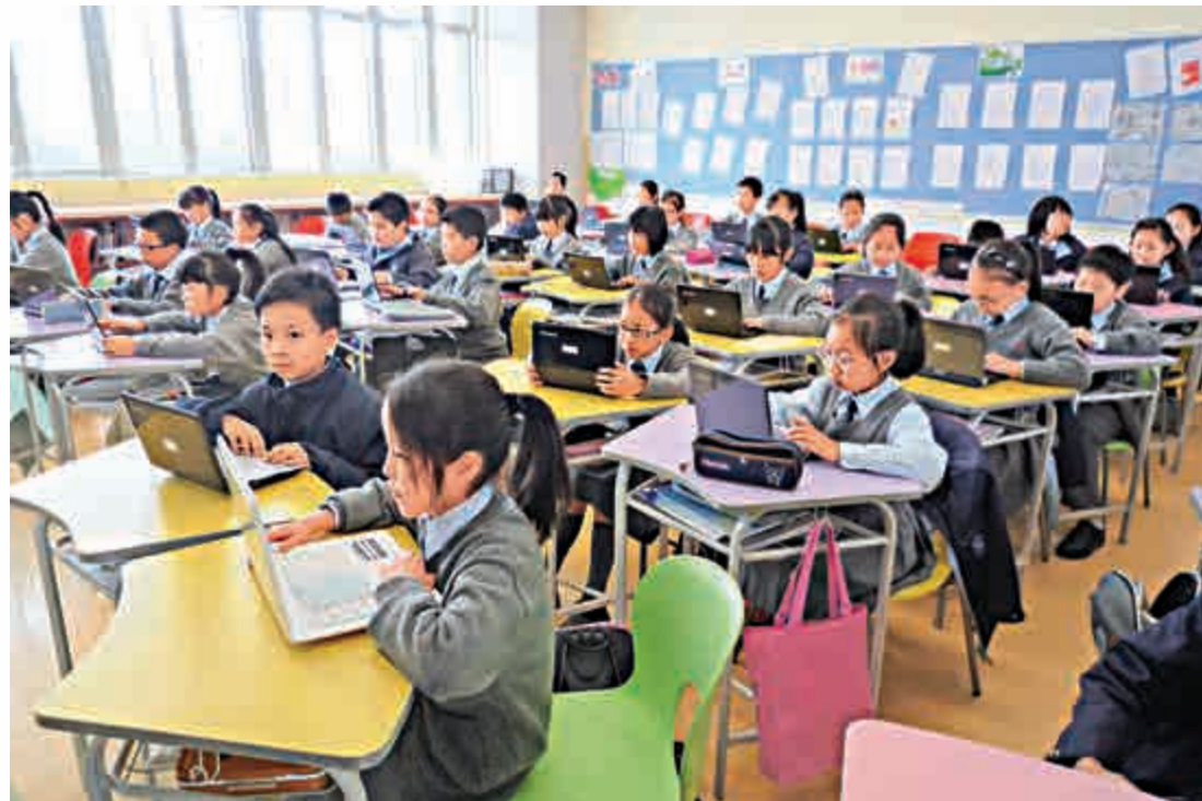
▲香港近年的教改，以培養學生能力為主幹，鼓勵多元化學習

與此同時，上海的教育改革一點也沒放鬆，升學制度、課程測考等亦是與時並進。最近兩次的2009年及2012年的「學生能力國際評估計劃」（簡稱PISA）中，上海首次參加便一口氣連續兩屆名列第一，分數更是遠遠拋離排名第二的國家地區，更聽說下屆不打算參加了。知道自己超班的實力，實在毋須要在這些國際比較中證明自己，倒反做多一些自我改善的工夫更為實際。