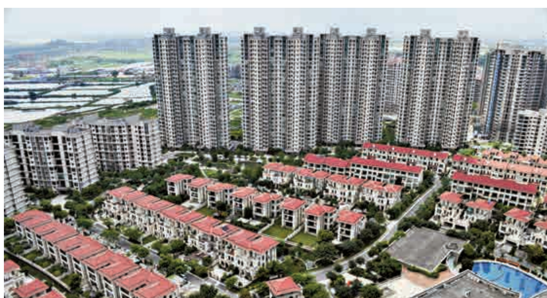
▲雅居樂昨宣布，5供1集資27.48億元，供股價4元較上一日收市價5.81元大幅折讓逾三成

周(21日)再有城市鬆綁，南京市公布結束三年零七個月的限購政策，買家不再需要提供新購住房證明。