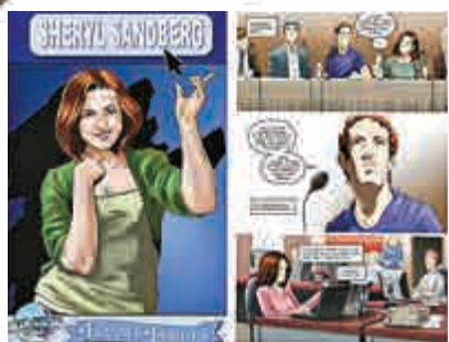
►桑德柏格將在本周發行的漫畫書現身 網絡圖片