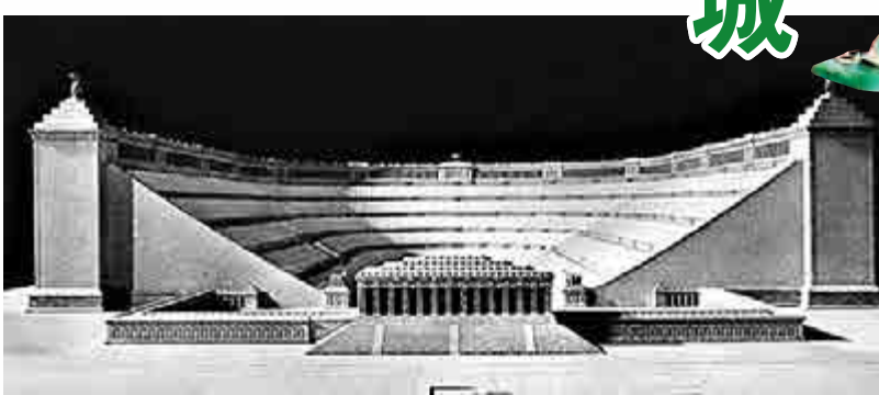
▲這座城市的面積是羅馬聖伯多祿大教堂的兩倍 英國《每日郵報》

整個工程由建築師斯皮爾負責，他將受建築計劃影響的2.4萬原雅利安居民，遷移到原來猶太人居住的單位。