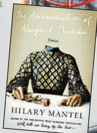
▲英國前首相戴卓爾夫人 ▲《刺殺瑪格麗特·戴卓爾》的封面

門特爾是英國著名的女權主義作家，其劇作和小說深受歡迎，還曾兩次榮獲布克獎。她的作品近月來搬上倫敦舞台，大為賣座。此次並不是門特爾第一次捲入此類爭議。去年她說過，凱特王妃已經從一個「用來當衣服架子的洋娃娃」變成了「一個只為繁育下一代而存在的女人」。