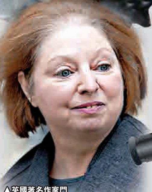
▲英國著名作家門特爾