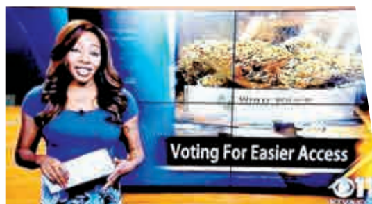
▲格林在節目中爆出自己就是當地一家大麻俱樂部負責人

在今年11月的州公民投票中，阿拉斯加州選民將決定是否讓娛樂用大麻合法化。如果公投過關，阿拉斯加州將成為繼科羅拉多州、華盛頓州之後，美國第3個通過娛樂用大麻合法化的州。