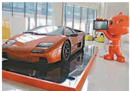
▲兩年年輕人網購零件組裝跑車，馬雲花100萬元買下

此外，阿里雲與萬科(02202)宣布達成戰略合作，雙方將通過應用雲計算、物聯網和大數據技術，打造內地首批物聯網的小區。作為首個合作項目，萬科將把在48個城市運行的設備遠程監控管理系統，部署至阿里雲計算平台。該系統已實現小區的供電、供水、消防、電梯、空調等設備，運行數據和狀態遠程監控的可視化管理，同時融入物業管理功能，實現集中運營和集約化管理。