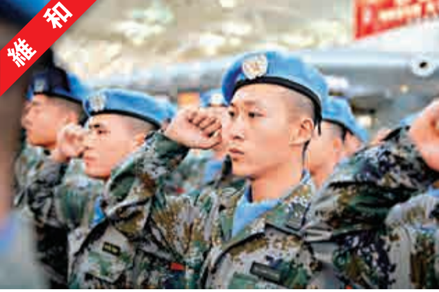
▲ 中國第二批赴馬里維和部隊後續分隊205名官兵，24日下午出征飛赴非洲馬里共和國 新華社

、強勢推進，着力建設「忠誠、打仗、和諧、學習、成才」型司令部。 廣州軍區司令部表示，廣州軍區各級司令機關認真貫徹落實習主席重要指示和軍委總部決策部署，牢固樹立「建為戰」思想，積極適應未來作戰信息主導、體系對抗、聯合制勝的特點要求，按照體系建、建體系的思路，整體推進自身建設，有效履行職責使命，保持了穩步發展的良好態勢。 成都軍區司令部提出，樹立打贏標準，推動司令機關工作和建設創新發展。成都軍區各級司令機關深入學習領會習主席國防和軍隊建設重要論述，針對參謀長難於專注作戰、司令部吸引力下降、訓練標準隨意性大等問題，着眼強軍興軍，創新實踐善謀打仗司令部。 武警部隊司令部表示，各級司令機關要緊扣能打勝仗核心要求抓建設、強能力、謀發展，組織指揮部隊圓滿完成以執勤處突為中心的多樣化任務。