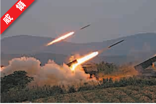
▲ 「火力-2014·三界」跨區演習24日上演重頭戲：濟南軍區某炮兵旅多種火炮實彈射擊