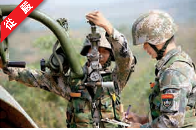
▲ 「火力-2014·三界」是今年中國陸軍炮兵防空兵部隊參加的「火力」系列演習的最後一場