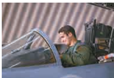
▲沙特阿拉伯王儲之子哈利德24日駕駛F-15戰鬥機