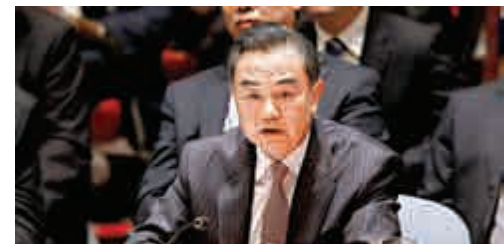
▲中國外長王毅24日在安理會反恐峰會中發言

鬥爭必須發揮聯合國和安理會的主導作用，唯有如此才能維護團結，才能有效協調，才可以一致行動；二是多措並舉。國際反恐鬥爭需要在政治、安全、經濟、金融、情報以及思想領域綜合施策，標本兼治，尤其是致力於消除恐怖主義產生的根源和滋生的土壤。採取軍事行動必須符合聯合國的憲章和安理會的決議；三是統一標準。恐怖主義不論以何種形式出現，不論何時何地，針對何人何事，都必須予以打擊。不能採取雙重標準，更不能與特定的民族和宗教掛鉤。王毅針對恐怖主義的新動向和新變化提出四點主張。第一，加大信息的搜集與分享；第二，加強網絡反恐；第三，切斷流動和融資渠道；第四，推進去極端化。