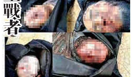
▲美國國務院在推特上上傳ISIS武裝分子的屍體照片

上傳屍照 美阻嚇聖戰者 【大公報訊】據英國《每日郵報》25日報導：美國打擊極端組織「伊斯蘭國」(ISIS)的策略，由空襲延伸至網絡。國務院於社交網站推特上傳聖戰者屍體的照片，希望阻嚇打算加入ISIS的民眾，呼籲三思不要步他們後塵。 為對抗擅打網絡宣傳戰的ISIS，美國國務院於推特展開名為「三思後行，及時回頭」(Think Again Turn Away)的網絡戰，並於周三上傳4具屍體，以及無人戰機瞄準ISIS車隊的照片，宣稱死者是於美軍空襲敘利亞的行動中身亡，暗示有意加入ISIS的人將落得如斯下場，希望起到阻嚇作用。