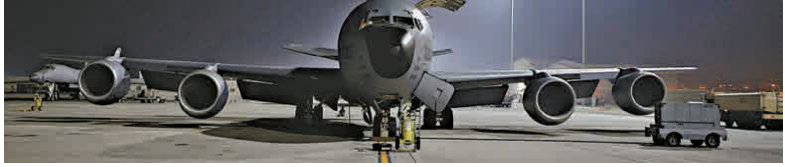
▲一架為空襲敘利亞提供支援的美軍KC-135空中加油機

上傳屍照 美阻嚇聖戰者 【大公報訊】據英國《每日郵報》25日報導：美國打擊極端組織「伊斯蘭國」(ISIS)的策略，由空襲延伸至網絡。國務院於社交網站推特上傳聖戰者屍體的照片，希望阻嚇打算加入ISIS的民眾，呼籲三思不要步他們後塵。 為對抗擅打網絡宣傳戰的ISIS，美國國務院於推特展開名為「三思後行，及時回頭」(Think Again Turn Away)的網絡戰，並於周三上傳4具屍體，以及無人戰機瞄準ISIS車隊的照片，宣稱死者是於美軍空襲敘利亞的行動中身亡，暗示有意加入ISIS的人將落得如斯下場，希望起到阻嚇作用。