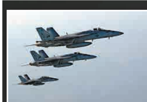
▲美軍F-18戰鬥機編隊25日參與空襲行動