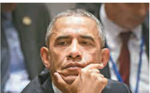
▲美國總統奧巴馬24日在安理會會議中發呆

結一致，我們就能看到的結果，包括消除敘利亞化學武器、建立中非共和國維持和平行動，以及對非洲大湖區和平框架提供及時的支持。但安理會缺乏團結時，比如在敘利亞問題上安理會一直不團結，導致該國人民遭受了嚴重的磨難，以及安理會本身和聯合國機構的可信度受損。