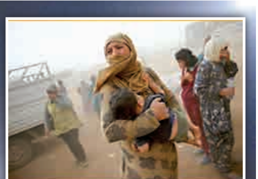
▲一名敘利亞難民24日在沙塵暴中等待轉路