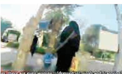
▲神秘女子偷拍ISIS「首都」的畫面 互聯網

此段錄影隨後被法國電視頻道轉播，此前法國有約150名婦女決定前往ISIS生活。蒙面攝影師在卡拉的一個網吧找到了她們。影片顯示，網吧中的一些婦女正通過互聯網用法語和家人聯繫。其中一人說：「媽，我不會回去的。我不想回去是因為我在這裡過得很好。你沒有必要因為我的選擇而哭泣或無謂的擔憂。」