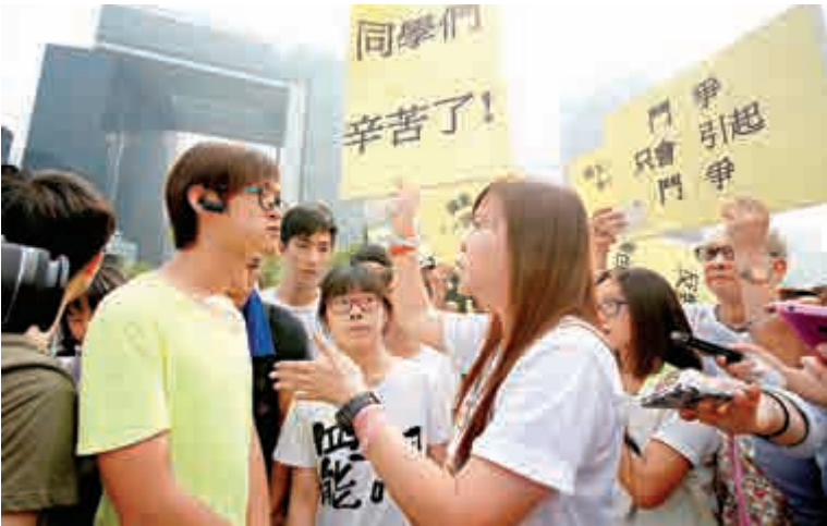
▲十多名香港家長聯會成員，遊行到罷課集會的添馬公園，要求與學生及講者交流