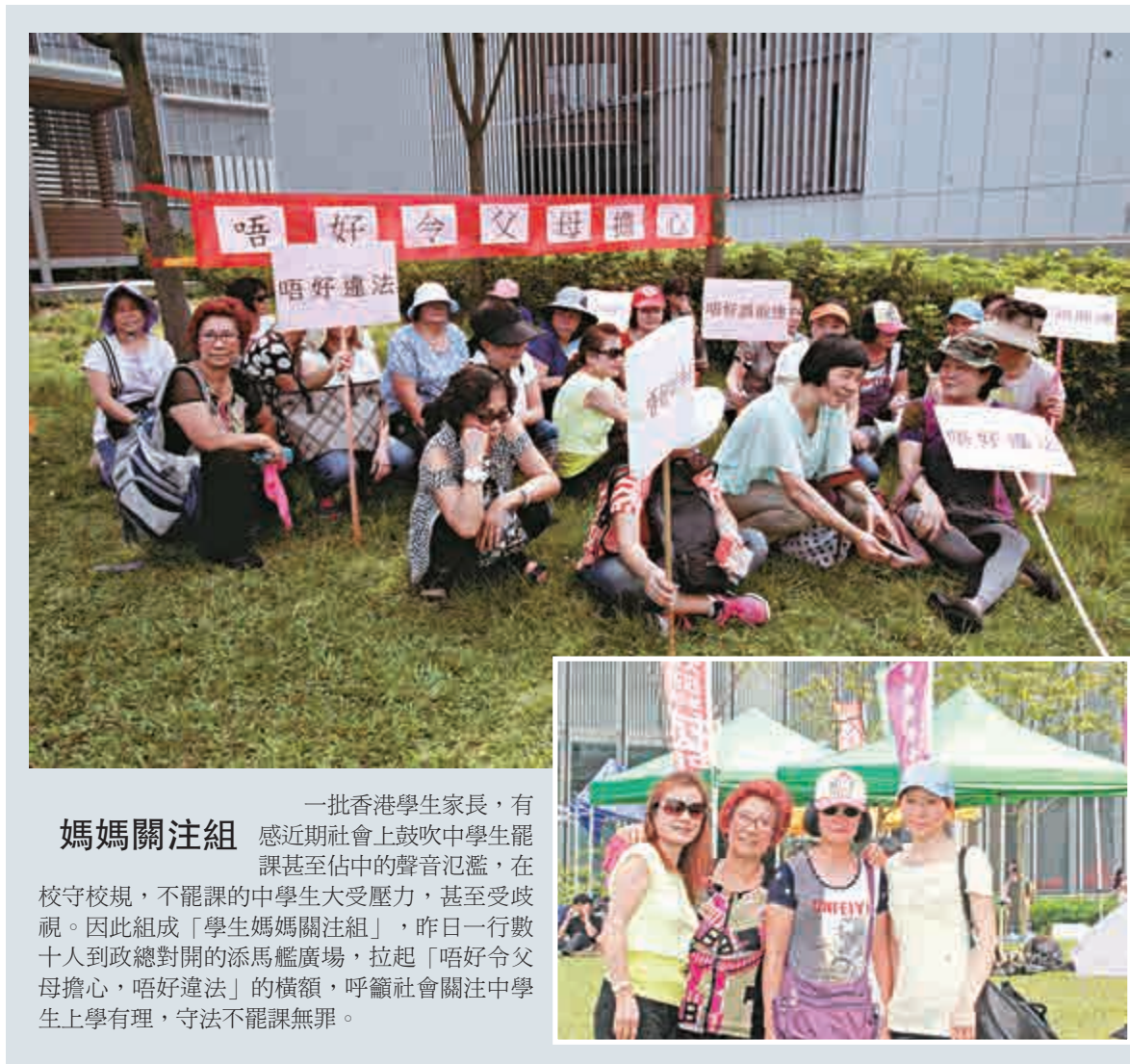
一批香港學生家長，有感近期社會上鼓吹中學生罷課甚至佔中的聲音氾濫，在校守校規，不罷課的中學生大受壓力，甚至受歧視。因此組成「學生媽媽關注組」，昨日一行數十人到政總對開的添馬艦廣場，拉起「唔好令父母擔心，唔好違法」的橫額，呼籲社會關注中學生上學有理，守法不罷課無罪。

醫管局行政總裁梁栢賢昨日指出，醫管局已按照以往處理大型群眾活動的方法做足準備，距離中環最近的律敦治醫院、瑪麗醫院，在佔中期間急症室將「full team上陣」，位於柴灣的東區醫院則將作為專科治療支援，醫管局總部亦將制訂候召名單。若出現重大突發事件，九龍區的伊利沙伯醫院、瑪嘉烈醫院將作為增援。