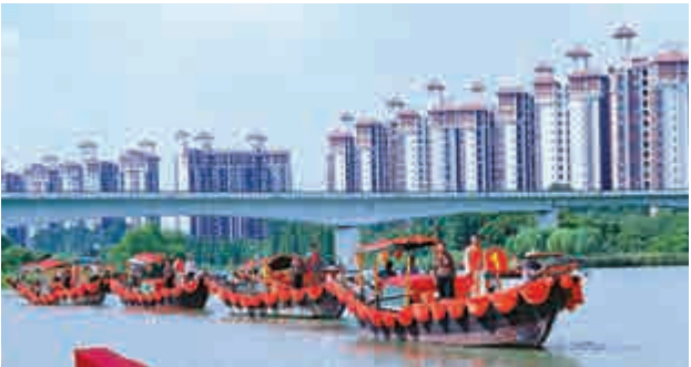
▲新郎哥帶著禮品、乘着花艇迎親