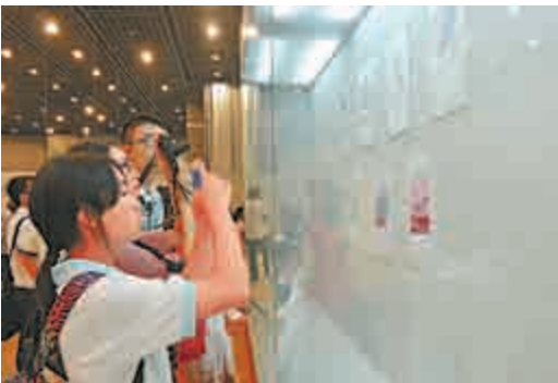
◀孩子們看完「二戰漫畫主題展」深有感動，留下祈求和平的寄語

【本報記者黃寶儀廣州二十七日電】27日在廣州開幕的「二戰漫畫主題展」上，內地首次集結展出中國大陸、台灣、韓國等地漫畫家筆下的二戰主題作品，讓青少年透過漫畫了解了戰爭給世界人民留下的深刻痕跡。不少青少年看完展覽後，深有感觸，紛紛在展館和平牆上留下了自己對和平的祈禱。