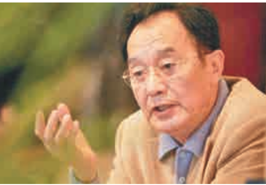
▲張賢亮的主要創作時期是從改革開放後的傷痕文學開始，直到上世紀末 資料圖片

世界各國發行，在國際上有廣泛影響。1992年12月在鄧小平「南方講話」後創辦寧夏夏西部影視城公司，擔任董事長。如今公司所屬的鎮北堡西部影城已迅速發展成為中國西部最著名的影視城，是《大話西遊》、《新龍門客棧》等100餘部影視作品的拍攝基地。