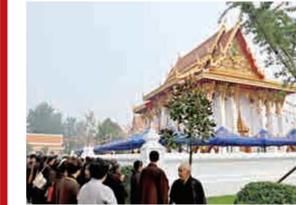
▲剛剛完工的白馬寺泰國風格佛殿

這枚舍利是1896-1898年間，由英國考古學家佩普在迦毗羅衛國一個崩毀的磚佛塔遺址中發現的。佛塔遺址有五個裝有骨灰的滑石質地的舍利容器。其中一個容器上，用古老的波羅蜜文字刻着：「這是釋迦族佛陀世尊的舍利容器，乃是有名的釋迦族兄弟與其姊妹、其妻子等共同奉祭之處。」洛陽白馬寺被稱為「中國第一古刹」，是佛教傳入中國後的第一座官辦寺院。