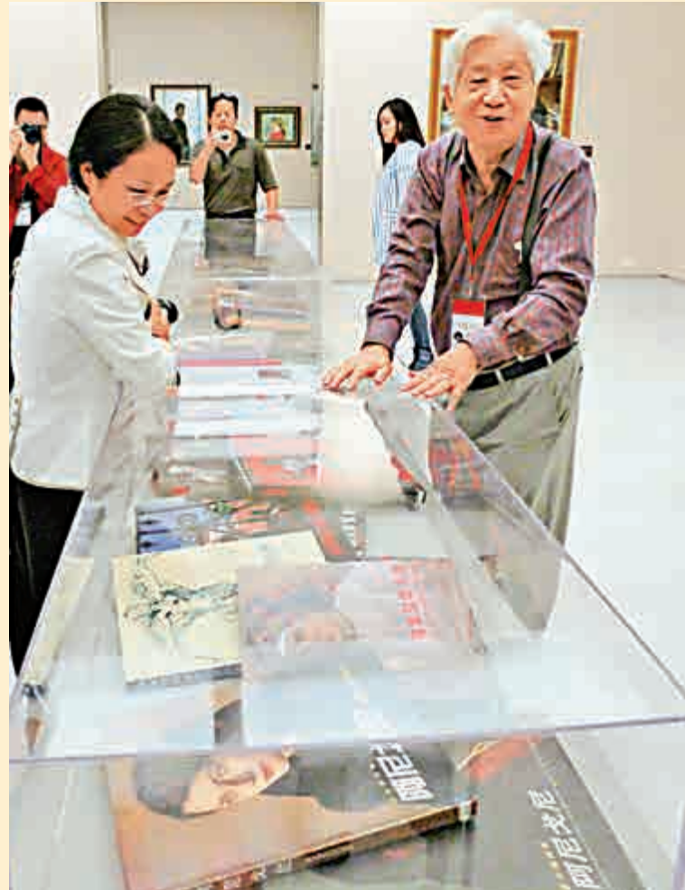
全山石各時期代表作品展中同時陳列全山石出版的西方油畫家的作品解讀 本報攝