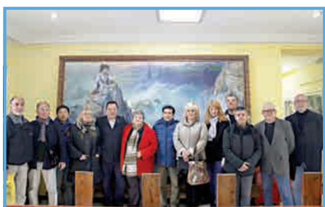
俄羅斯文化代表團合影