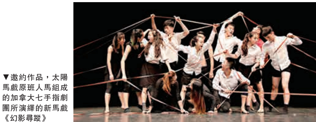
邀約作品，太陽馬戲原班人馬組成的加拿大七手指劇團所演繹的新馬戲《幻影尋蹤》