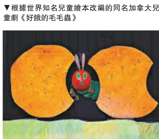
根據世界知名兒童繪本改編的同名加拿大兒童劇《好餓的毛毛蟲》