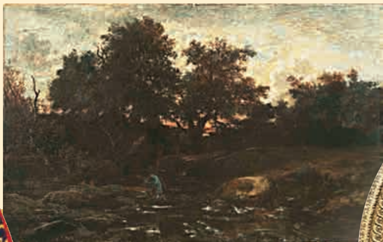
(法)盧梭《康塔爾的捕鮭漁人(奧弗涅)》(布面油畫，一八四六年)