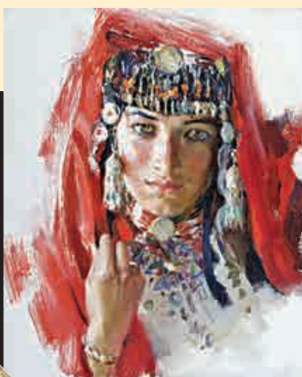
全山石《阿依古麗》(油畫，二〇〇八年作)