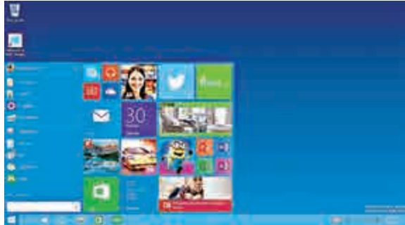
▲微軟提供的新視窗系統Windows 10的開始界面