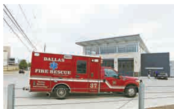
▲一輛救護車停靠在達拉斯市急救部門外