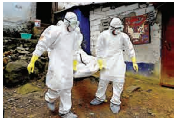
▲利比里亞醫護人員在首都蒙羅維亞抬走伊波拉患者的遺體