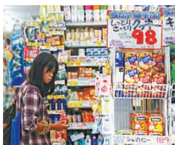
▲9月30日，一名女子在日本東京一家藥妝店內購物

赴日。今年上半年訪日外籍觀光客來自中國比去年同期大幅增長，消費也創新高紀錄。因此，業界很期待免稅制度的施行，為業界創造新的契機。