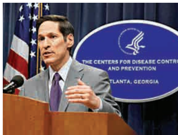
▲美國疾病控制防治中心主任弗里登9月30日召開記者會