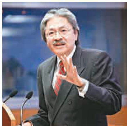
▲曾俊華指，現時金融體系維持正常，但對「佔中」影響經濟非常憂慮

【大公報記者彩雲報道】「佔中」引發的示威行動持續多日，多個地區反「佔中」市民與示威人士爆發衝突。財政司司長曾俊華昨首開腔回應事件，他強調「佔中」帶來的衝擊，當局短期內仍可處理，但示威活動長期持續將會帶來影響，包括投資者或會對本港形象產生負面印象。曾俊華指事件持續將令社會分化，影響下一代，希望示威者放下個人立場，合力解決問題。