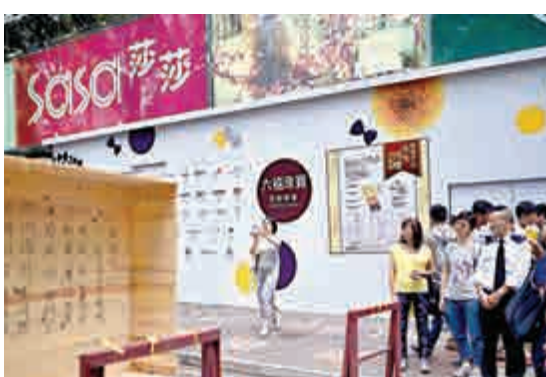
▲莎莎超過八成業務依賴本港，「佔中」活動對其打擊最大