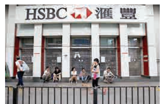
▲旺角滙豐銀行仍未能恢復營業

根據昨日下午4時30分銀行向金管局的報告，受影響的銀行營業網點數目陸續減少，是由於銅鑼灣、旺角及金鐘地區有13個網點能重新運作；惟昨日約四時，有2間銀行因應旺角和銅鑼灣的最新情況，分別關閉了旺角3個及銅鑼灣1個網點，累計共有12間銀行的15個網點需要暫時關閉。