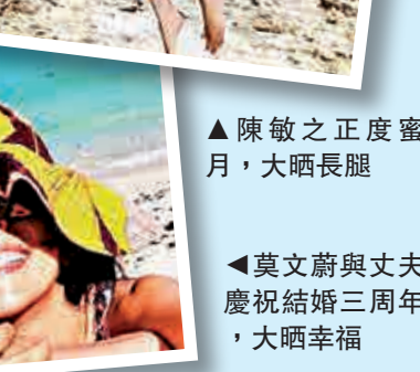
▲莫文蔚與丈夫慶祝結婚三周年，大晒幸福