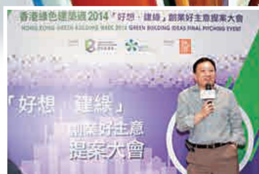
▲香港綠色建築周2014「好想·建綠」創業好主意提案比賽