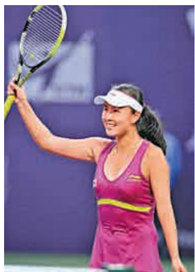
►中國選手彭帥賽後向觀眾致意

【綜合外電天津七日消息】二號種子中國球手彭帥，周二於WTA天津網球公開賽首圈旗開得勝，成功以7：5、4：6、6：2殺敗以色列球手皮爾晉級，聯同分別取得首圈勝利的鄭賽賽及張帥晉身次圈。同日頭號種子塞爾維亞球手珍高域亦以6：2、0：6、6：0擊敗俄羅斯球手古達雅絲娃，次圈將與鄭賽賽對壘。