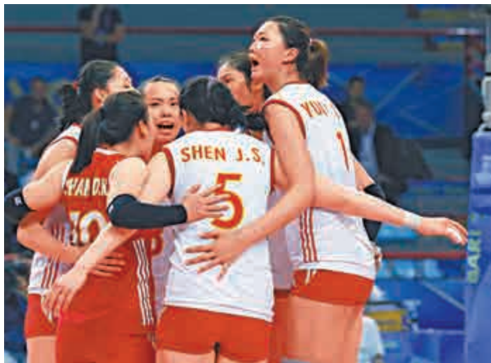
▲中國女排今晚面對一場硬仗