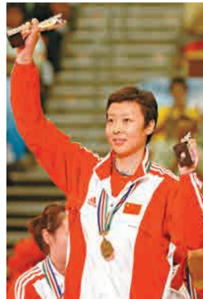
▲這是馮坤作為中國女排隊員時獲獎的資料圖片

這對跨國情侶將在泰國和北京舉行兩場婚禮，時間定在12月和明年1月。有情人終成眷屬，讓我們祝福這對有緣人！