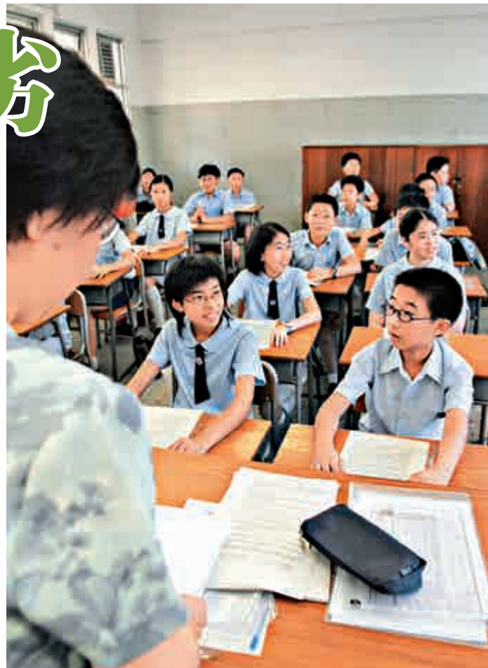
▲要比較港滬教師的學歷，香港的不會比上海差 資料圖片

算，則是約17小時，在數字上比上海沒有太大的差異。但在工作上，香港教師在班務、課外活動、家校合作以及行政事務方面，均比上海的同行有更重的負擔；而新課程和評估亦要教師在忙碌課餘預備一些可能是配套不足的教學法。反之，上海教師卻以傳統教學為主，備課充足，批改迅速，也便成了課堂教學的必然優勢。故此，一般教師的教學已有扎實的基礎，而到匯聚名師的重點學校，更是優勝幾籌，這也是近兩次PISA「國際學生評估計劃」中上海獨佔鰲頭的主要原因。