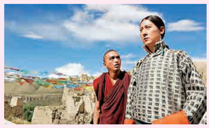
▲呈現西藏百年歷史的開幕電影《西藏天空》

國電影基金會理事長張丕民、民政事務局長常任秘書長馮程淑儀、中央人民政府駐香港特別行政區聯絡辦公室宣傳文體部部長朱文、香港影視界慶祝國慶籌備委員會主席林建岳、香港電影發展局主席馬逢國，以及開幕電影《西藏天空》導演傅東育、《遷徙》和《滾拉拉的槍》導演寧敬武等。