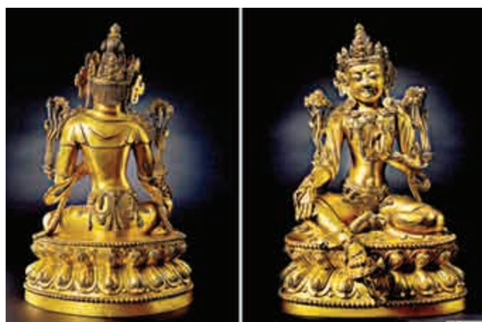
▲銅鑲金觀音菩薩像以一千四百一十六萬元成交

「中國古董珍玩」共有三個專場，分別是「中國古董珍玩」專場、「東渡，西來」——禪林名僧墨蹟與中、日、韓佛教美術專場，以及「稽古」宋代瓷器、銅器和石雕專場。當中，最高價作品為銅鑲金觀音菩薩像以一千四百一十六萬元成交；「稽古」宋代瓷器、銅器和石雕專場，北齊石雕釋迦牟尼立像起拍價為二百八十萬港元，經過多輪競價最終以七百三十二萬高價成交。這個環節整體成交額為近一億元。